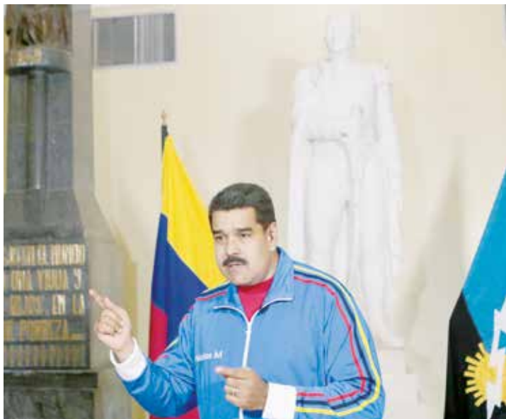
Maduro denunció actitud injerencista de Kelly.

“No puede ser que nosotros produzcamos el petróleo y los especuladores financieros pongan el precio. No puede ser que nosotros, Rusia, Arabia Saudita, Irán, Irak, Emiratos Árabes, Ecuador, Bolivia, Colombia, Venezuela, produzcamos el petróleo con un gran esfuerzo de inversión y el sudor de los trabajadores, y vengan unos especuladores de la bolsa a poner precio”, subrayó el presidente Maduro. •