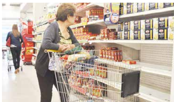
Diversos productos de Alimentos Polar también fueron incrementados

Vale destacar que la diferencia de precios de los productos de Polar y los similares de otras marcas está en el orden de un 50% aproximadamente. Eso ocurre con el arroz en versiones no reguladas, como el perlado o el saborizado, que lo ofrecen en 120 bolívares mientras los de otros distribuidores se venden entre 83 y 92 bolívares.