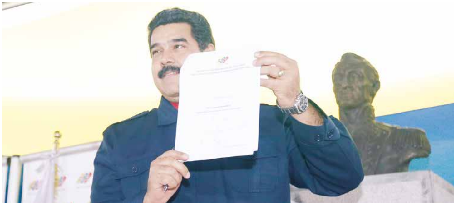
El presidente Maduro manifestó su respaldo a los resultados electorales.

Desde la llegada de la Revolución Bolivariana se han sumado 21 procesos electorales (entre presidenciales, municipales, parlamentarios, regionales y hasta referendos), los cuales han contado con la presencia de distintos observadores internacionales, quienes han dado la certeza del éxito de las jornadas. Organismos como el Centro Carter, la Organización de Estados Americanos (OEA), Organización de Naciones Unidas (ONU),