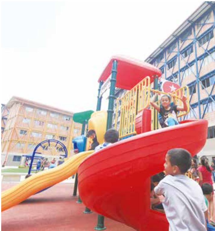
La GMVV es uno de los grandes logros de la Revolución.

tros, ensartado en una viga de hierro que le entró por la espalda y le salió por el abdomen. Lo vi en Cuba, recuperándose y esperando por una intervención que le hacía falta. Una intervención gratis: en Venezuela las clínicas privadas lo remendaron hasta sacarle el último centavo que tenía, y cuando ya no pudo pagar más lo mandaron a pudrirse en la calle.