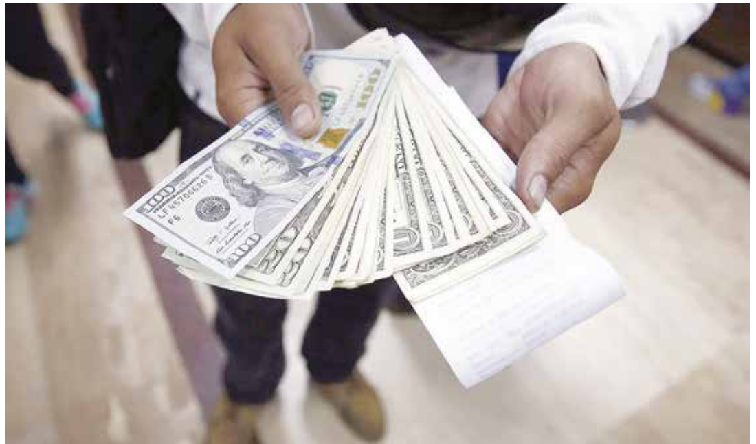
Se pretende escamotear el aumento de la capacidad adquisitiva del venezolano.