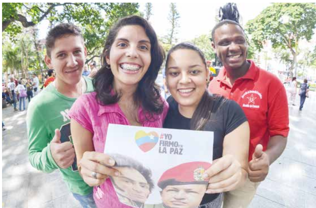
Unidos ante cualquier ataque a la democracia.