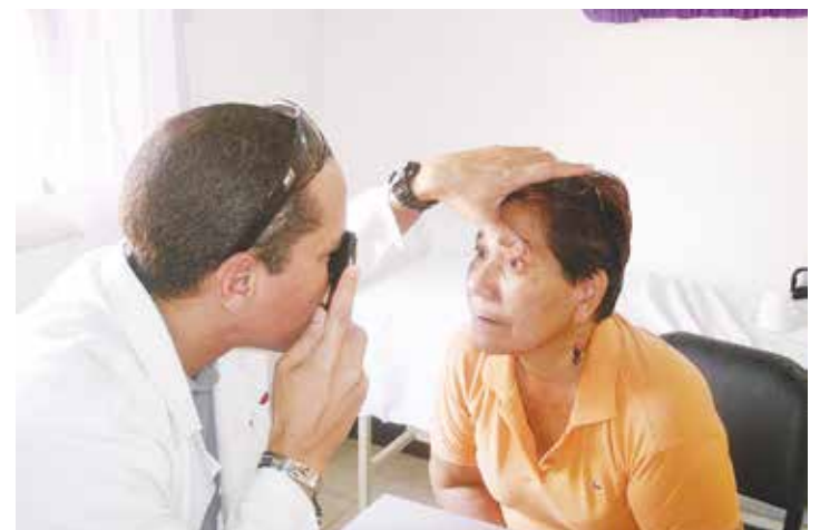
Millones de venezolanos se han beneficiado por el apoyo de la medicina cubana.

Con los enemigos conscientes de su rol histórico es fácil lidiar; con los incurables uno no sabe si confrontarlos o dejarlos morir su muerte lenta. Ayúdenme con esa reflexión. •