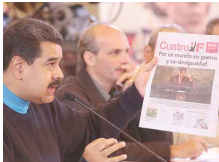
Es necesaria una geopolítica anticolonialista y antiimperialista.

“ Solo la paz puede garantizar la viabilidad del plan 2030 y de las relaciones internacionales en nuestro planeta ”