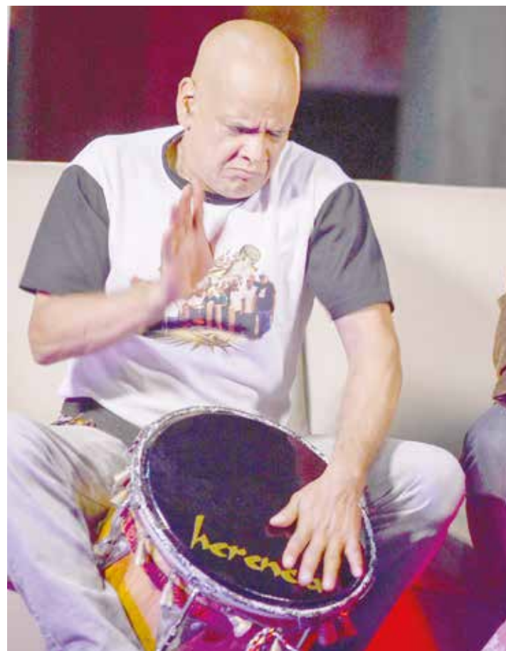
Los músicos tendrán rondas promocionales.

“ El lugar que la música merece, premisa de la Fimven se perfila como el primer mercado musical de Venezuela que le permitirá a los artistas nacionales mostrar su talento”