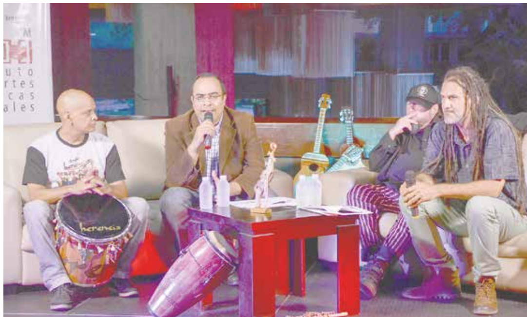
Participarán músicos nacionales e internacionales.

C4 Trío se unirá a esta fiesta de ritmos el 9 de octubre, y lo hará en compañía de Yusa, cantante cubana que fusiona los ritmos tradicionales de su país con el jazz, funk y rock.