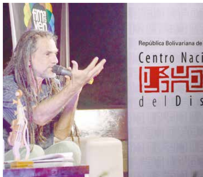
Este evento también servirá como espacio para el análisis.

La programación detallada de la feria estará disponible en el portal www.fimven.com.ve . Para mayor información consultar las cuentas en Twitter @FIMVEN / @PlataformaIAEM / @CendisMusica y en Facebook FIMVEN, Plataforma IAEM y Cendis Avanza. •