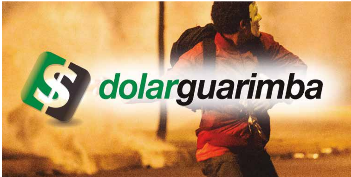
Las alzas del dólar guarimbero ocurren con una intencionalidad política.

Fenómenos sociales enquistados en la sociedad colombiana, tales como el narcotráfico y la parapolítica, permitieron la creación de un marco regulatorio sin ninguna lógica económica y que ahora sirve para atacar al bolívar