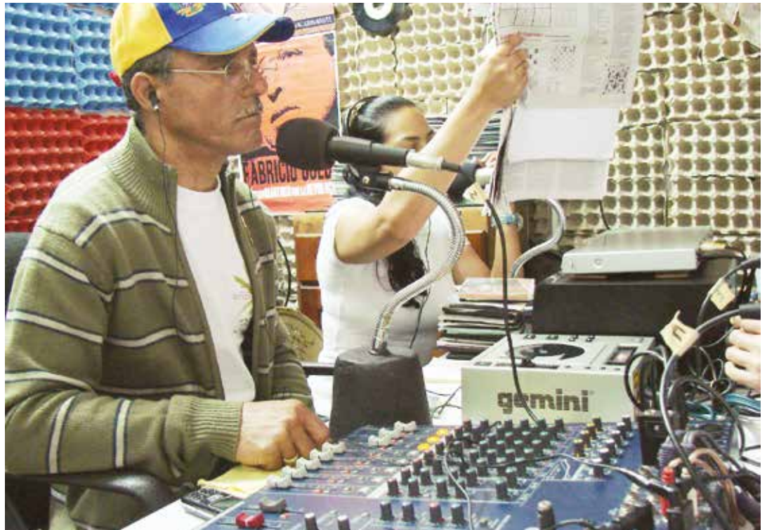
Debemos revisar urgentemente nuestra política comunicacional fronteriza.

No es casual entonces que todos los problemas se congreguen en nuestras fronteras y que de pronto nos estallen en el rostro de manera trágica y violenta. Al no visibilizarlos en los trabajos periodísticos, esos problemas no se conocen en los espacios centrales de cada país. Los medios ni siquiera tienen entre sus fuentes a las zonas fronterizas como algo obligado en la investigación periodística y entonces esas situaciones llegan de manera