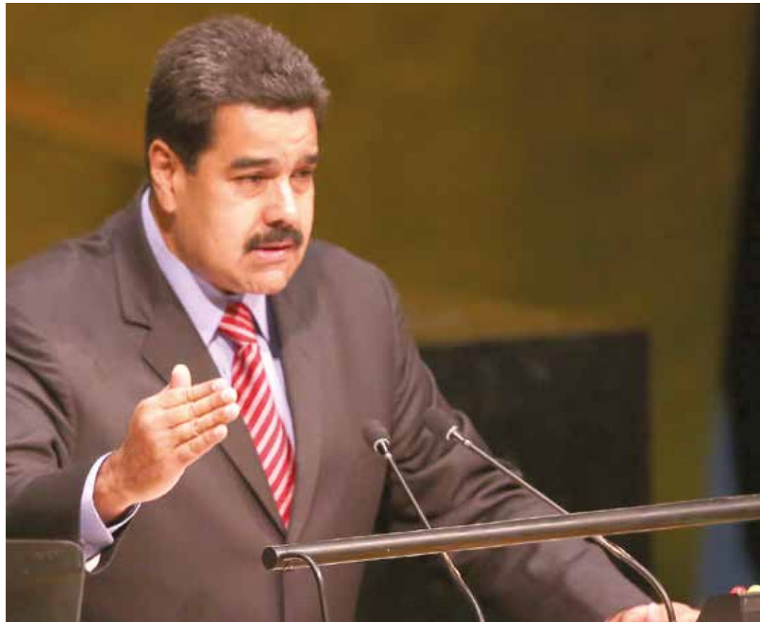
Nicolás Maduro en la ONU

“¿Por qué en esa región del mundo- se refirió a África, Asia y al Medio Oriente- se está viviendo una película de terror? Millones de hermanos musulmanes, árabes y del Medio Oriente, migran masivamente buscando un hilo de paz, una luz de esperanza. La causa específica, concreta que ha impactado a estos pueblos hermanos de Afganistán, Irak, Libia, Si-