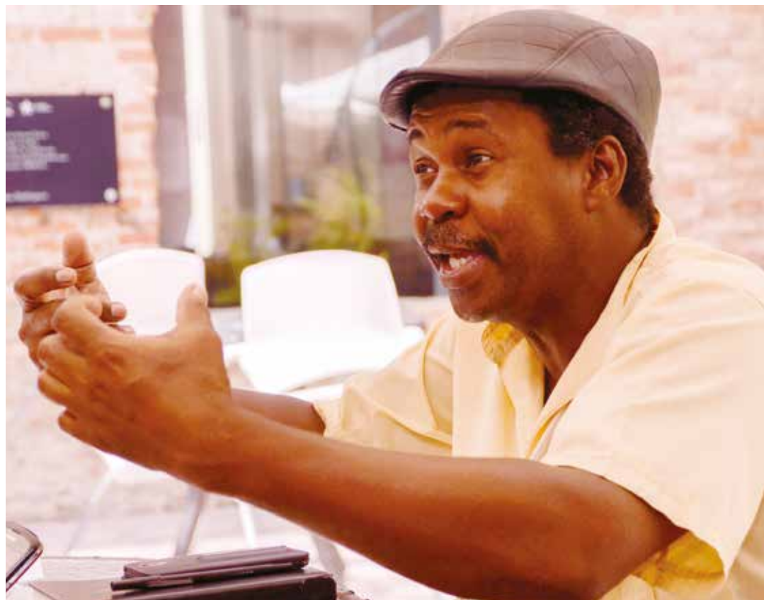
Ha surgido la cultura colombo-venezolana.

"Por supuesto, la situación política colombiana no era fácil, las contradicciones se estaban agudizando", recuerda, así como también que "todo cuadro cultural era un objetivo político" de la derecha colombiana, o bien para ponerlo al servicio de sus intereses a