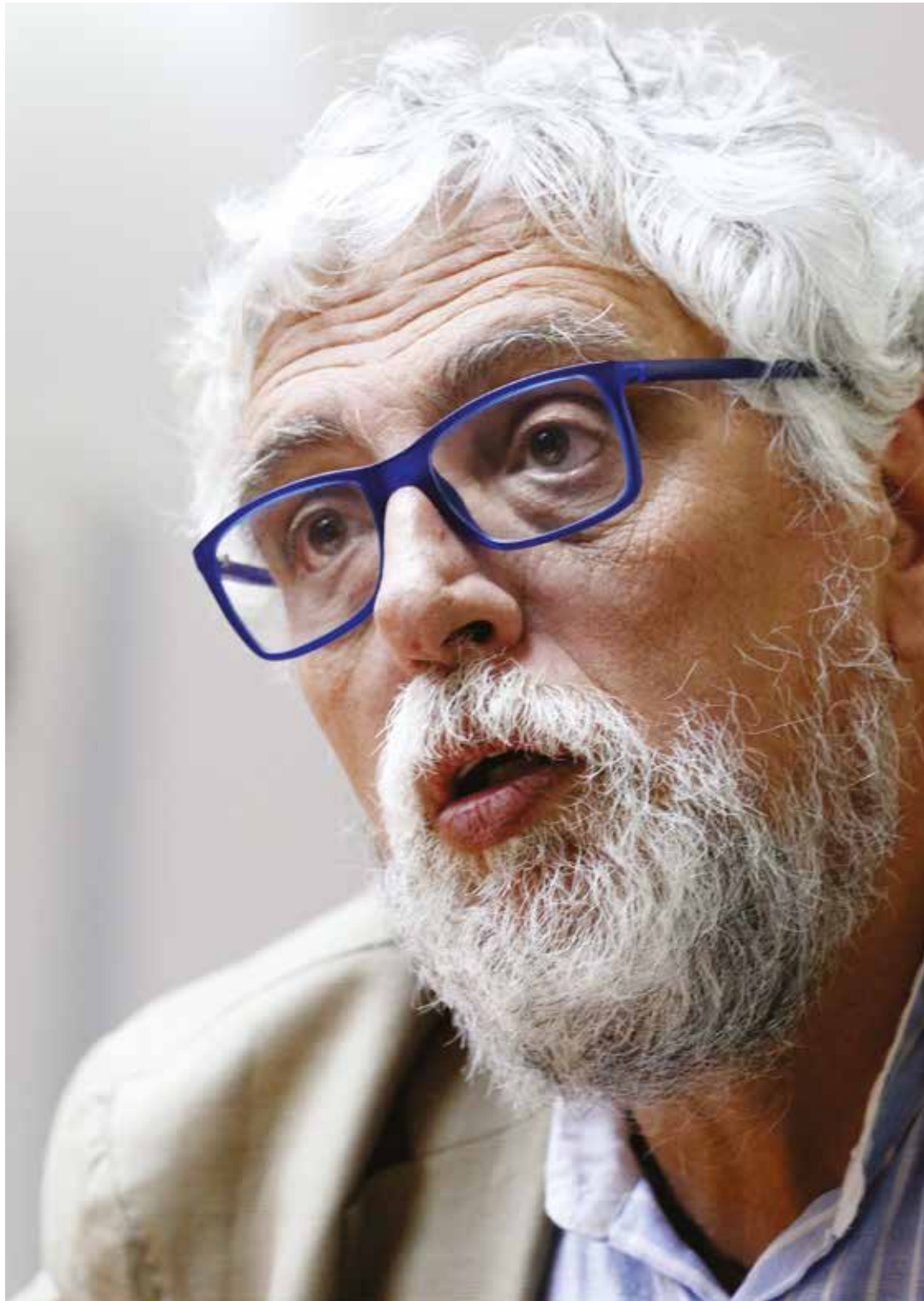
Vasapollo: la guerra es la solución a la crisis del capitalismo.

Vasapollo, autor del libro “La rebelión de los cerdos”, de visita por Caracas para dictar una serie de cursos en la Escuela Venezolana de Planificación, observa en la actualidad uno de los más complejos ciclos de crisis en el capitalismo mundial de la cual pareciera no poder salir sino por medio del uso de la guerra como herramienta, la cual sirve para “dinamizar” bien sea a través de los gastos que genera o mediante los planes de “reconstrucción” de las naciones a las que previamente se ha destruido. Así, los Estados Unidos y la OTAN (el brazo armado de la Unión Europea) se han involucrado desde los años noventa en un creciente número de conflictos, algunos de alta intensidad como la guerra de Irak y Afganistán o el actual ataque contra Libia, y también en otros de “nueva generación” como ha ocurrido en Ucrania o la propia “guerra económica” a la que se ha sometido a la población de Venezuela en los últimos dos años.