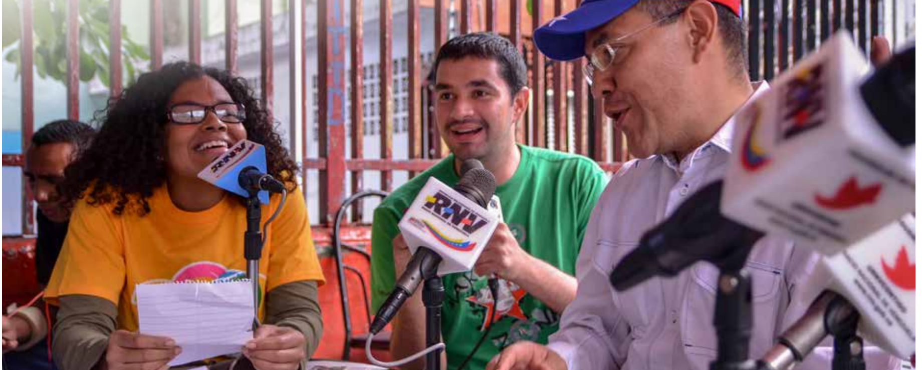
Las esquinas calientes serán el principal escenario de este programa radial.