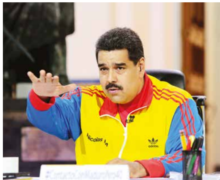
El Presidente ha propuesto un plan de seis meses para la normalización

“La ultraderecha de allá y de acá aspiraba a que nos declaráramos la guerra. Pero no nos dirigen los extremismos locos, porque lo que está planteado es la coexistencia de dos modelos. Somos diversos, pero somos hermanos”.