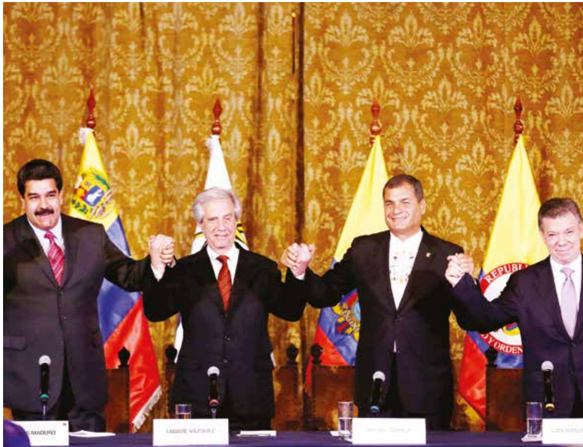
En Quito se logró un acuerdo con siete puntos claves.

Confesó que fue una gestión de paz en circunstancias muy duras.