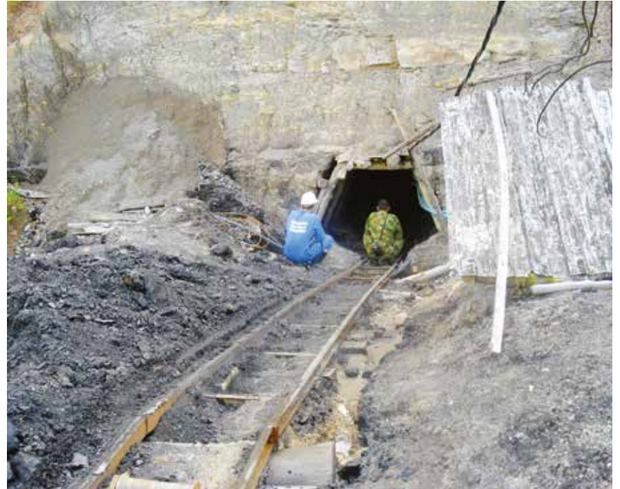
Son enormes los daños a la salud generados a los trabajadores de las minas de carbón.

Venezuela tiene petróleo para más de 100 años: son 299.953 millones de barriles que con toda certeza están esperando por ser extraídos del subsuelo. Eso es cien veces más de lo que tiene Colombia"