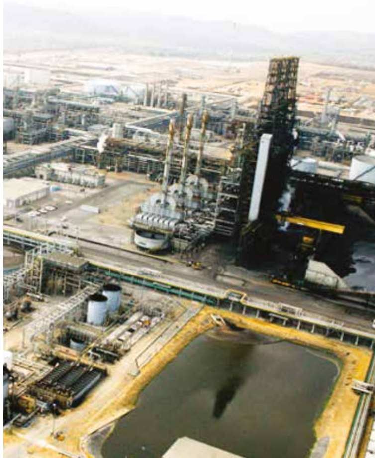
El petróleo no debe venderse por debajo de 70 dólares el barril.

La ultraderecha de allá y de acá aspiraba a que nos declaráramos la guerra. Pero no nos dirigen los extremismos locos, porque lo que está planteado es la coexistencia de dos modelos. Somos diversos, pero somos hermanos"