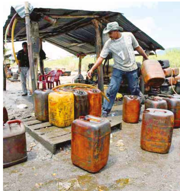
Ahora son enemigos del alcalde de Cúcuta

empleo digno, realizada por el ministro del Interior en su visita a Cúcuta al inicio del cierre fronterizo. En su intento por criminalizar a los sindicatos de vendedores de gasolina, el alcalde de la ciudad fronteriza aseguró que capturaron a un pimpinero utilizando un arma de fuego para impedir el abastecimiento en las estaciones de servicio. Mientras tanto, el diario colombiano La Opinión, indicaba que los problemas con combustible se extienden a la ciudad de Pamplona, debido a la escasa cantidad de gasolina asignada por el Ministerio de Minas en varios departamentos fronterizos con Venezuela a pesar de las reiteradas promesas del gobierno de Bogotá de enviar cupos adicionales de combustible. •