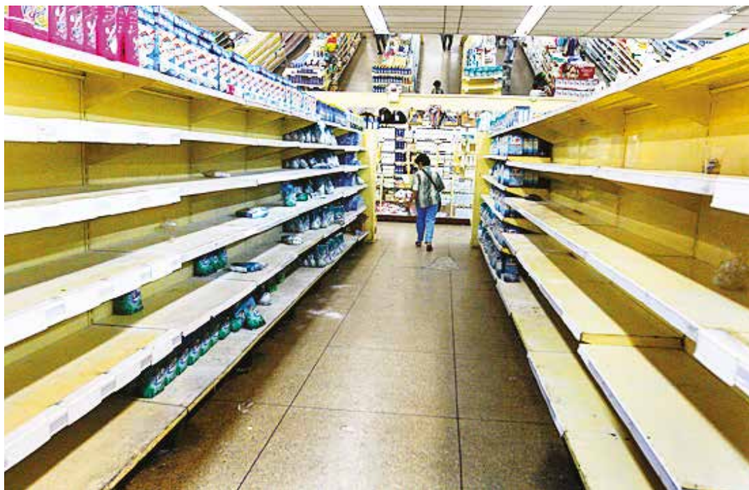
El desabastecimiento es parte de la guerra económica

El analista considera adecuadas las últimas decisiones del Ejecutivo en torno a la frontera, pues según su perspectiva, se estaba desdibujando la presencia del Estado venezolano en la línea limítrofe con Colombia y ninguna nación puede permitirse la pérdida de soberanía política y económica en su territorio. Los cálculos de las pérdidas que representaba para el Estado nacional el contrabando de gasolina y bienes básicos, además de la presencia de elementos de carácter paramilitar que controlaban estas actividades, justificarían una acción como la tomada por el Estado en cualquier parte del mundo. •