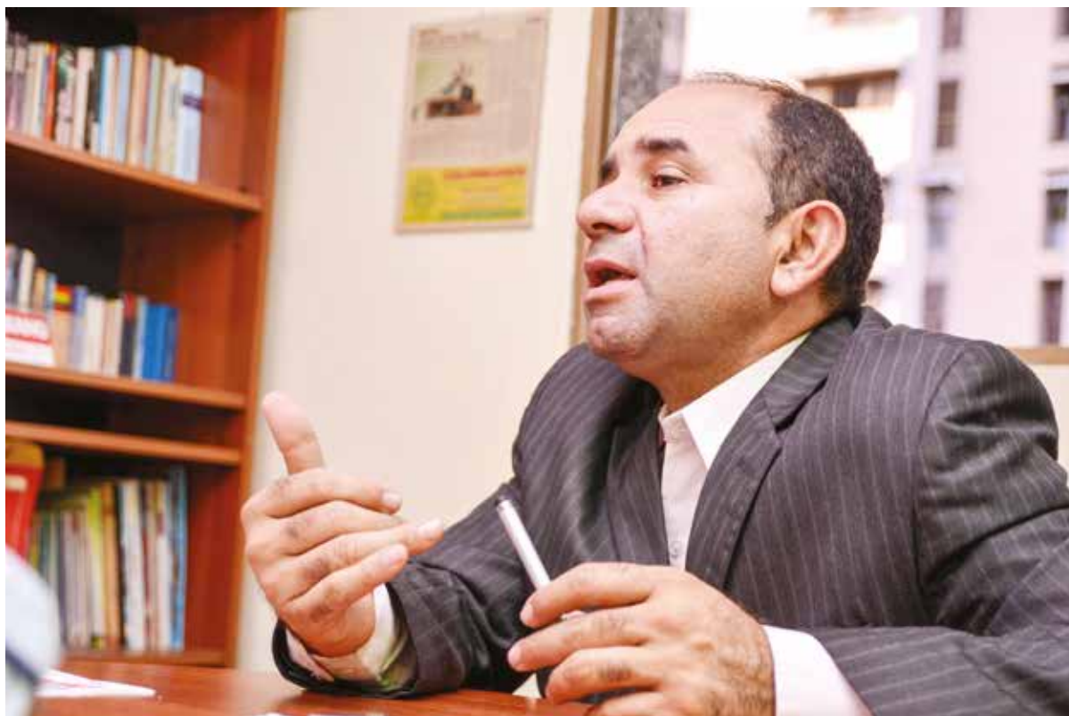
El colchón del paramilitarismo es el contrabando.

Reflexionó que el llamado del presidente Maduro obedece a una realidad, "creo muy oportuno la construcción de un gran Movimiento de Colombianos Bolivarianos, creo que es el momento, y aun-