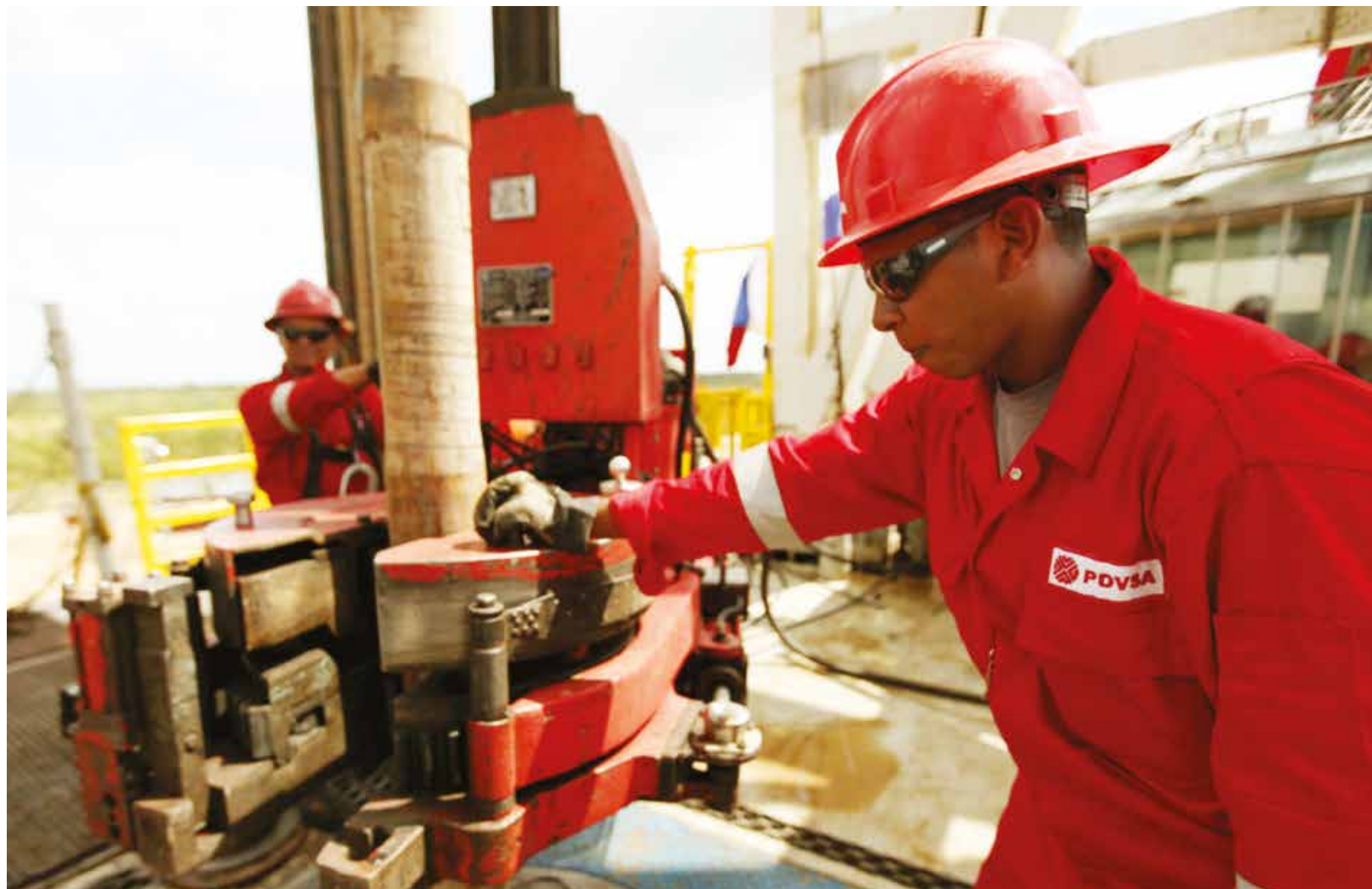
Venezuela posee el 20% de las reservas probadas de crudo del planeta.