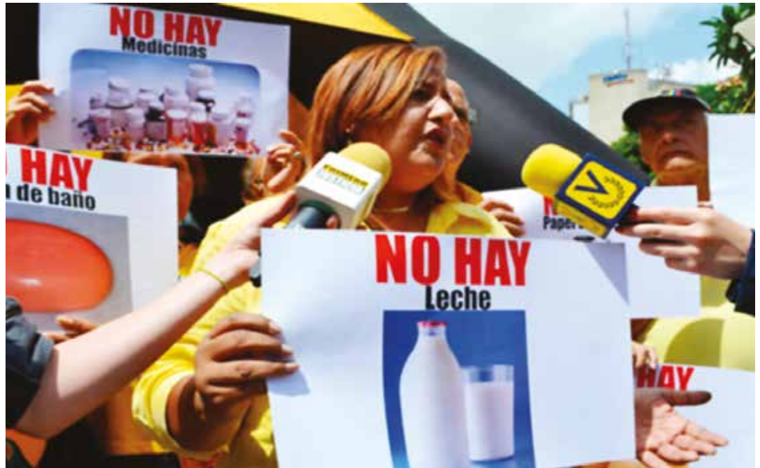
Quieren evitar que Chávez se convierta en liderazgo colectivo.

Uno de los principales ejes comunicacionales de las operaciones psicológicas en el exterior es la supuesta violación de Derechos Humanos. Esto pretende aislar a Venezuela en el mundo, neutralizar sus aliados, desmovilizar a los pueblos que apoyan el