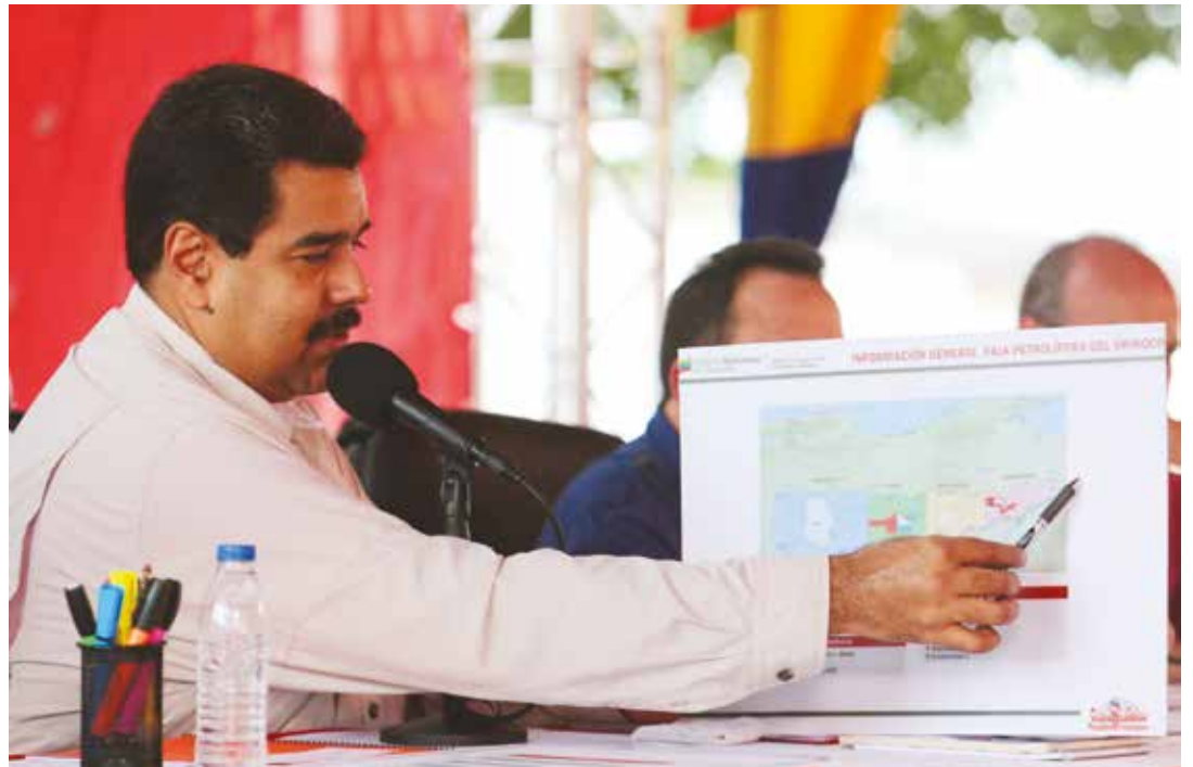
El Presidente explica el Plan Estratégico de Desarrollo de la Faja Petrolífera del Orinoco Hugo Chávez Fías.

En mayo de este año el presidente Maduro anunció la inversión de 14 mil millones