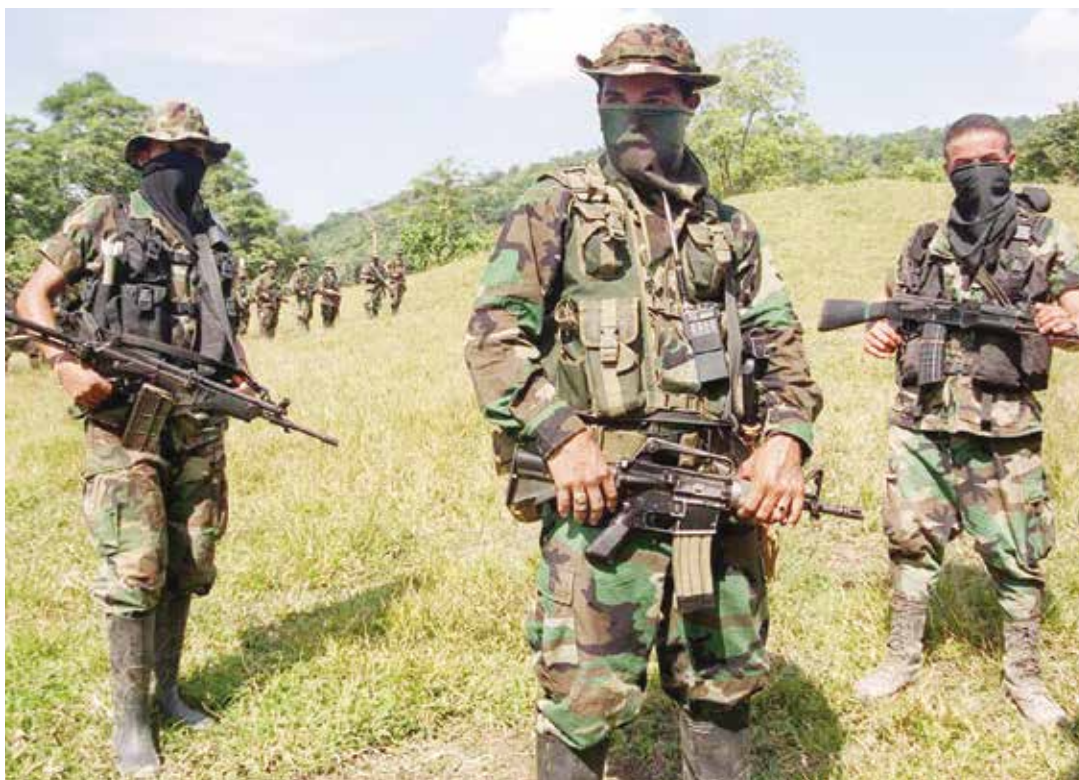
El paramilitarismo fue importado para torpedear la Revolución.

Lo más importantes es entender que es imprescindible mantener la unidad de los bolivarianos, arreciar el esfuerzo para materializar el Plan Nacional Simón Bolívar 2013-2019, acompañar al presidente Nicolás Maduro en el esfuerzo de dirigir la nación y es fundamental conquistar la victoria perfecta en diciembre próximo para continuar adelantando junto al pueblo la transformación de Venezuela. •