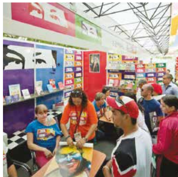
"Leer al país" significa no dejarnos sumergir ante el pragmatismo