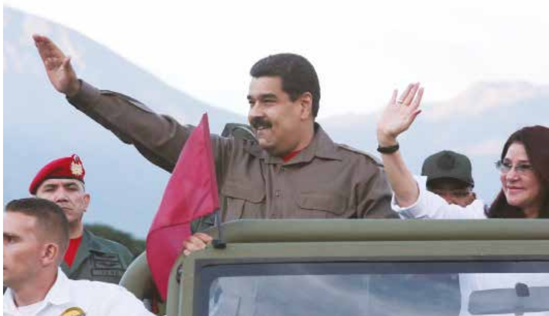
Debemos buscar la unión nacional para mantener la paz.

“Todas las unidades de nuestro Comando Antiextorsión y Secuestro están altamente capacitadas, equipadas y adiestradas con vehículos que han sido transformados en cuanto a su confección, a su dinámica, y han sido transformados desde el punto de vista técnico para que estas unidades cumplan con su cometido”, señaló Rivero, al mismo tiempo que enfatizó la especialización de este grupo de élite para combatir el paramilitarismo que existe en el país. •