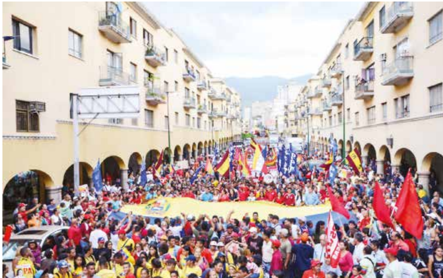
Si las elecciones fueran hoy el PSUV más el GPPSB tendrían una victoria arrasadora.

En las elecciones parlamentarias serán electos 167 diputados o diputadas, 113 nominales, 51 por lista y tres representantes indígenas de forma nominal”