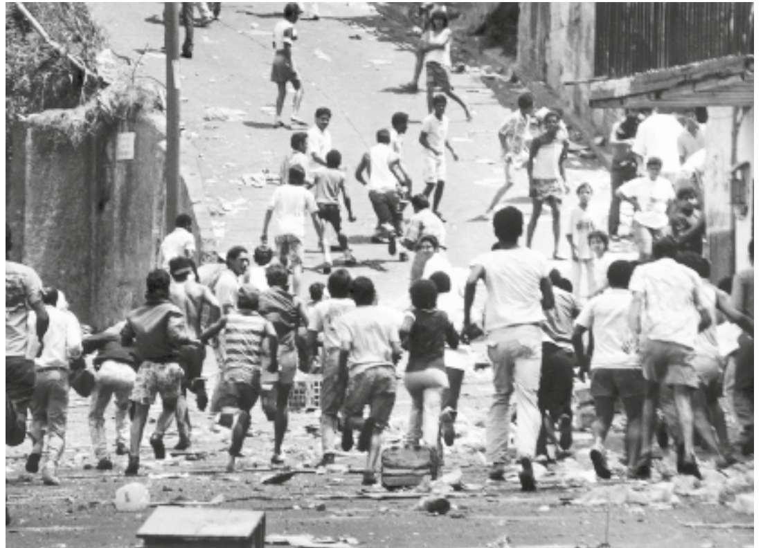
El 27 de febrero de 1989 se produjo una espontánea y auténtica Rebelión Popular antineoliberal

mandante Eterno Hugo Chávez, esa rebelión popular iniciada en 1989, se transformó en una Rebelión Económica, no sólo de los sectores más desposeídos, sino de todo un pueblo que ha decidido no retornar al fracasado modelo del capitalismo rentístico.