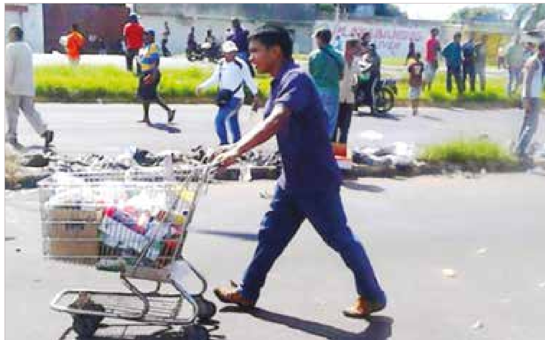
Lo que sucedió en San Félix se entiende como la agudización de las tácticas desestabilizadoras.

Durante el mes de enero del presente año, cuando el presidente Nicolás Maduro estaba en una gira internacional estableciendo alianzas para sortear unitariamente la caída de los precios del petróleo, se evidenció una aceleración vertiginosa de tácticas promotoras de caos y desastres. Justamente, la agudización y el esparcimiento del rumor mayoritariamente desde las colas en las ciudades más pobladas y con mayor influencia electoral del país (Maracay, Valencia, Maracaibo, Caracas y San Cristóbal) tenían como objetivo primordial incentivar saqueos en grandes cadenas de supermercados y distintos establecimientos comerciales.