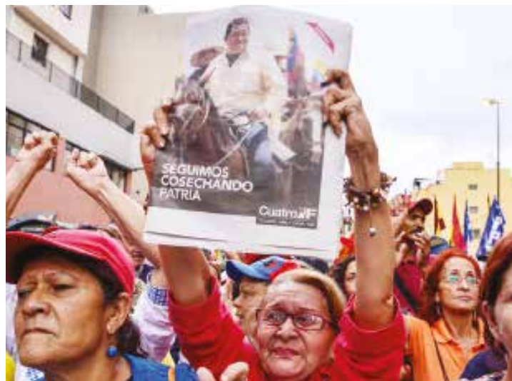
Las fuerzas revolucionarias le dicen al mundo que estamos en unión perfecta.

En este sentido, instó a la dirección nacional de los partidos del GPPSB a buscar un método cada vez más perfecto con el objetivo de ir a la designación y a la elección de las candidatas y candidatos. "Lo que hemos logrado hoy nos dice que sí se puede, el enemigo imperialista no se pudo meter con sus cochinos dólares ni por una rendija de las fuerzas populares", enfatizó