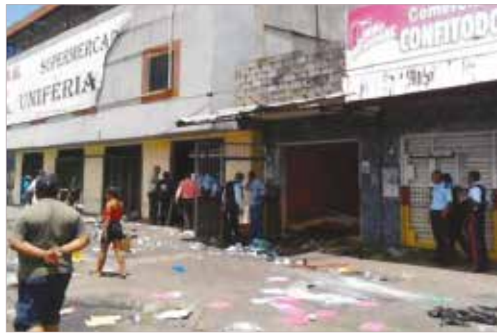
La derecha trata de imponer su tesis de "Estado fallido"

Es evidente que se intenta deslegitimar al chavismo ante un escenario que hasta sus mismos operadores dicen que no les favorece en las próximas elecciones. •