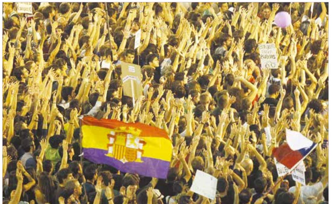
La plutocracia europea intenta desviar la atención sobre su pesada crisis capitalista FOTO ARCHIVO

Pero tal vez lo más imperdonable para la plutocracia ibérico-europea es que en este documental, de cuya realización formo parte Couso, se arriba a una conclusión: si el pueblo de España quiere algún día disfrutar de una democracia plena, como es hoy la venezolana, debe seguir el camino que trazó el Comandante Hugo Chávez: en lo político, activar el poder constituyente y la democracia participativa y protagónica; en lo económico, nacionalizar las empresas estratégicas para el desarrollo español y ponerlas al servicio de las grandes mayorías; y en lo comunicacional, democratizar el acceso del pueblo organizado y sus movimientos sociales a los medios de comunicación. •