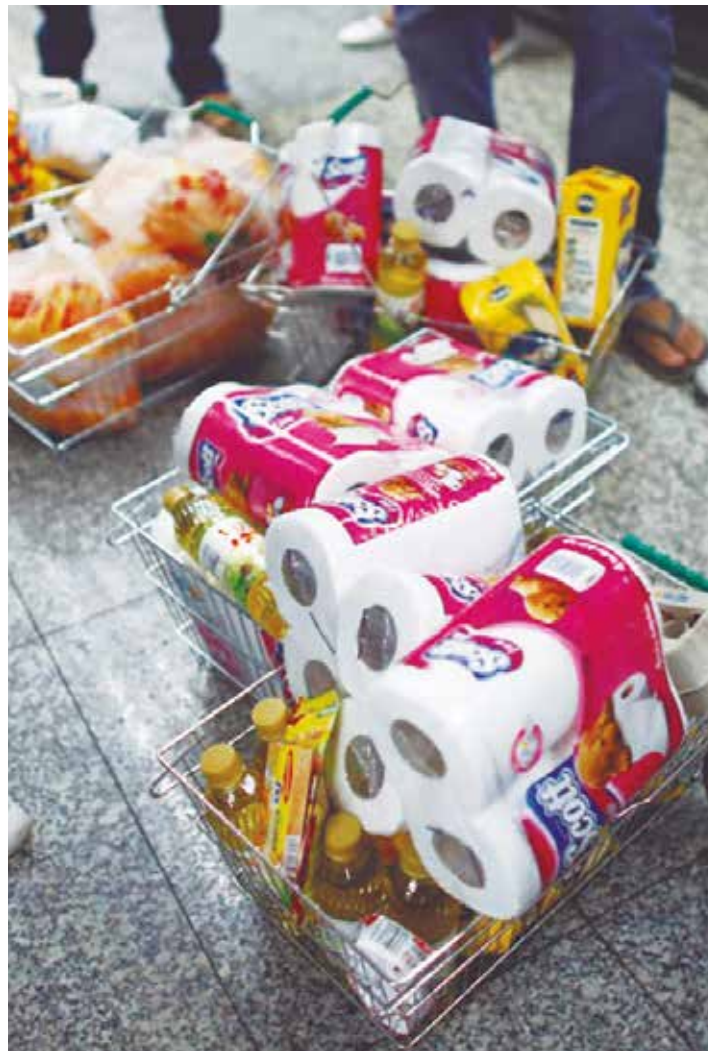
La guerra económica es la vía para desesperar a la población

10 En lo político y simbólico la derecha insiste en culpar al gobierno por el desabastecimiento y la escasez. Mientras que el gobierno