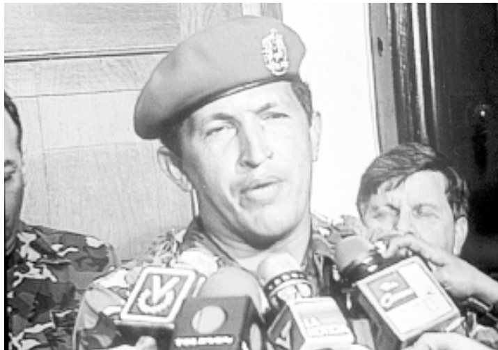
La rebelión popular se convirtió en rebelión económica

Esta es una verdadera Rebelión Económica que apunta hacia la superación del capitalismo y hacia la construcción del socialismo bolivariano y chavista. Por ello, el pueblo venezolano hoy está en rebeldía, en rebelión contra la burguesía y sus mafias de producción y distribución de productos; saqueadoras de divisas y de recursos. Los saqueadores son ellos, el pueblo no. •