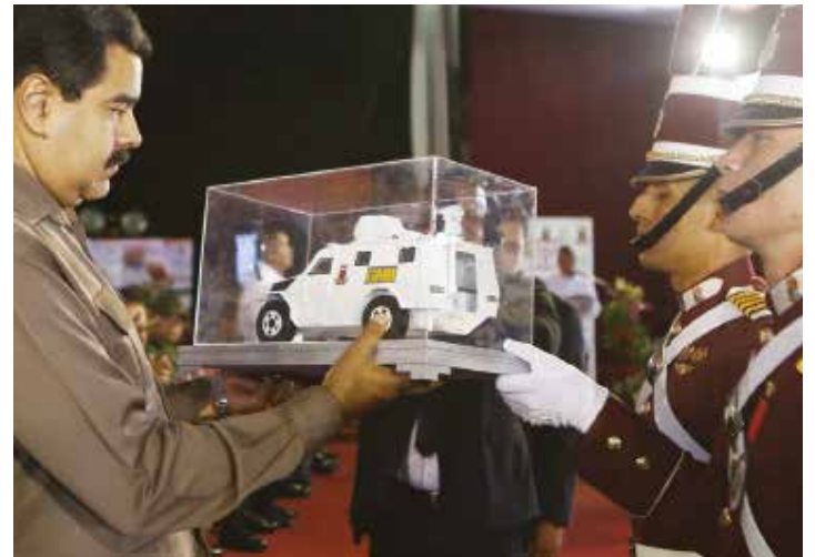
GNB es uno de los elementos clave en la OLP

“Tengo en mis manos dos documentos del Pentágono donde diseñan, para lo que resta de este año, la misma estrategia para intentar llenar nuestra Patria de violencia, caos, muerte, división, incertidumbre y angustia”, explicó Maduro ante un auditorio repleto de los diversos componentes de la Guardia Nacional Bolivariana, uno de los elementos clave en la acción de la Operación de Liberación del Pueblo. Como se recordará, en meses pasados el general del Comando Sur de los Estados Unidos, John Kelly, vaticinó una “implosión social” en Venezuela para el mes de julio, supuestamente impulsada por el binomio desabastecimiento-especulación, que debería llevar a un incremento de las tensiones sociales. A pesar de que no se cumplieron los de-