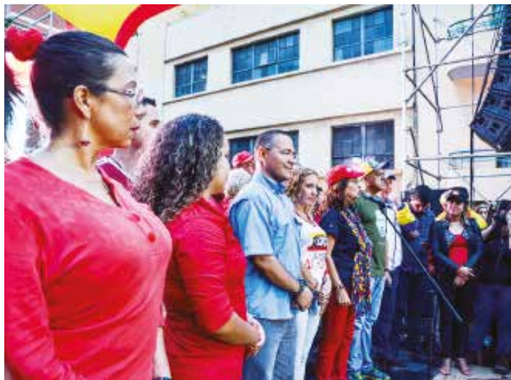
Candidatos del PSUV reciben el apoyo del pueblo.