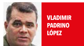
VLADIMIR PADRINO LÓPEZ

"Hay grupos de delincuentes que se han metido en las casas y a punta de armas sacan a los familiares a quienes les fue asignada esa vivienda, para luego formar su micro red de narcotráfico"