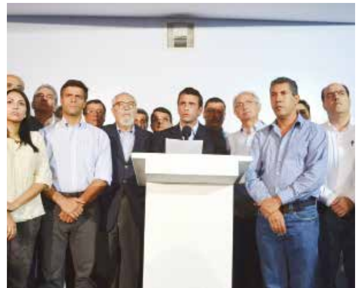
La oposición fascista busca dismantelar las conquistas sociales.

Optimizar y reactivar la producción en todos los sectores; eliminar los gastos superfluos del Estado; aplicar las leyes; romper la dependencia de las importaciones; asumir acciones económicas clasistas y acelerar la marcha hacia el socialismo, es la única receta posible para que la oligarquía no nos rompa el cuello ni el espinazo. •