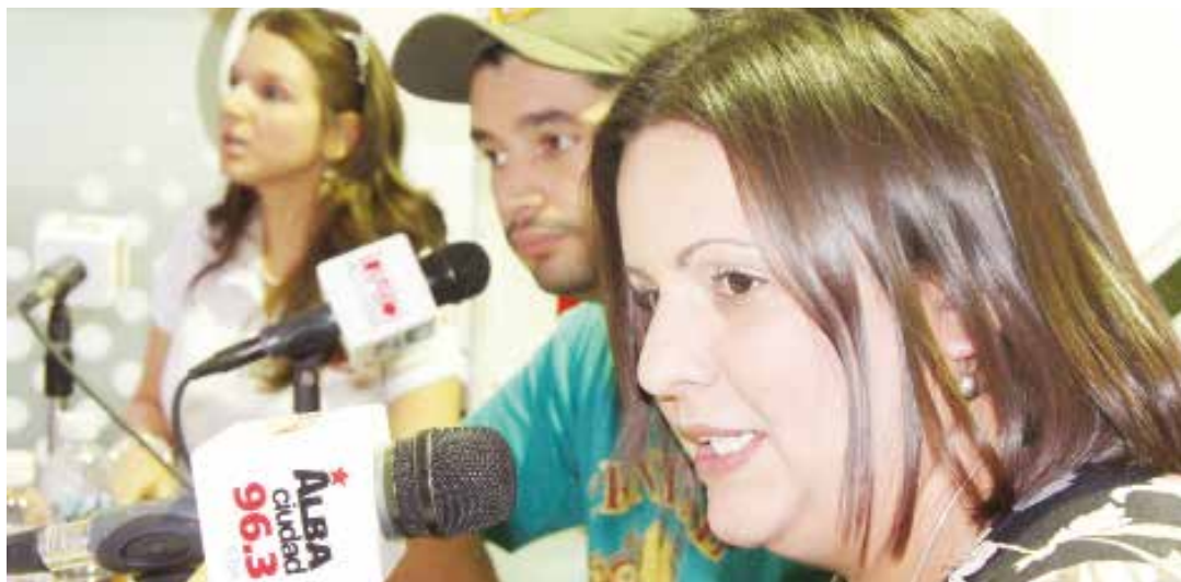
El joropo, la fulía, el tambor, deben ser conocidos en todo el planeta como géneros venezolanos..