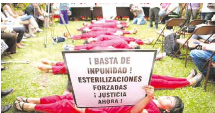
En España se esteriliza sin autorización a los discapacitados.

Uno de los aspectos más llamativos cuestionados por la ONU es la práctica establecida legalmente en España de la esterilización forzosa y sin autorización de personas con discapacidad.