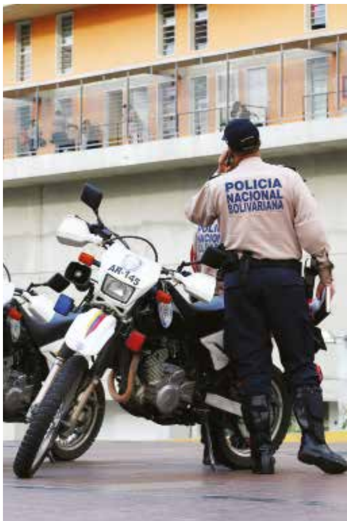
OLP en edificios de la GMVV ofrece resultados positivos

"Estoy preparando un conjunto de leyes habilitantes para apretar la mano, para que no vayan a creer que estamos jugando, que es concha de ajo", dijo el presidente Maduro cuando se ejecutaba la OLP en los edificios de la