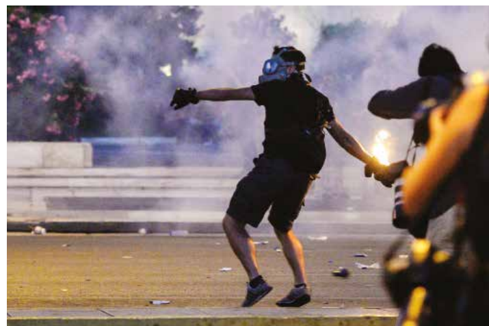
Con el dólar negro buscan la desestabilización.

De la variable cambiaria depende en buena medida la solvencia de la política económica aplicada en el país y, por lo tanto, también el relanzamiento del crecimiento económico. Es evidente que controles y medidas punitivas serán insuficientes para ello, habrá que trabajar también en la eficiencia y coherencia de las políticas económicas, así como también en el aumento de la producción. •