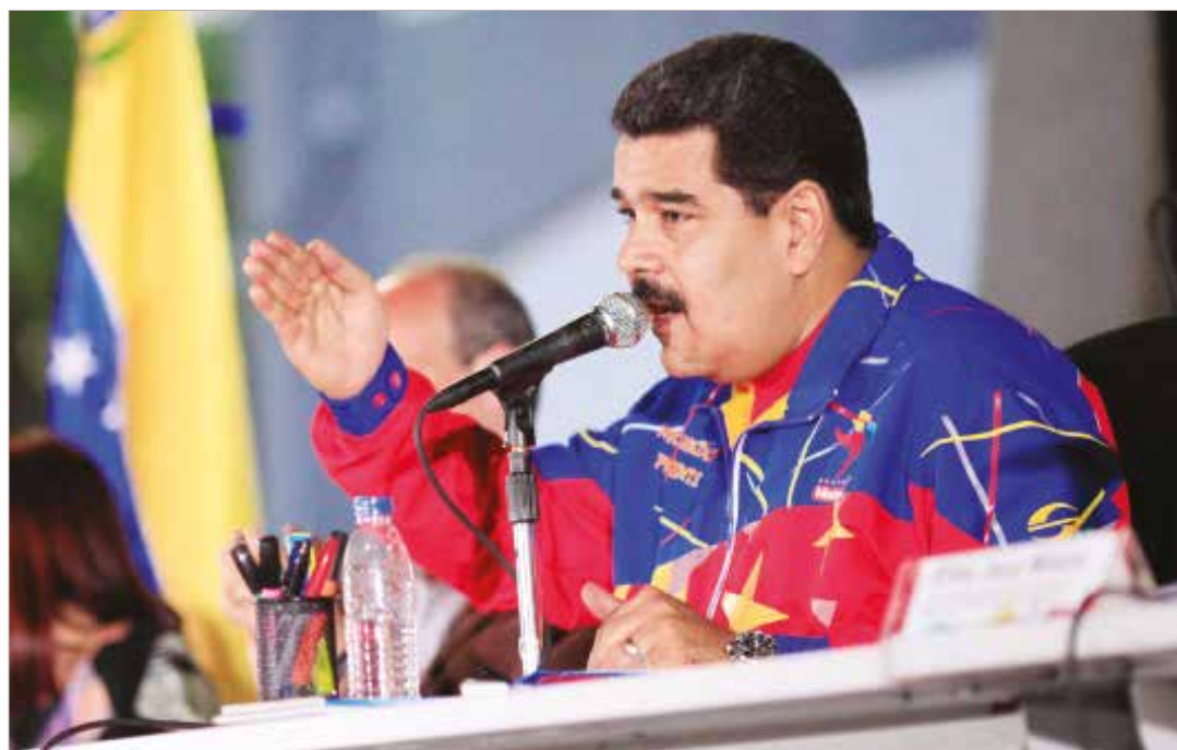
Maduro: les estamos haciendo seguimiento a los desestabilizadores.

Igualmente, aseguró que el papel de voceros de la derecha venezolana (como el candidato presidencial perdedor Capriles Radonski) es actuar como voceros de los intereses de Granger y sembrar la confusión dentro de Venezuela. •