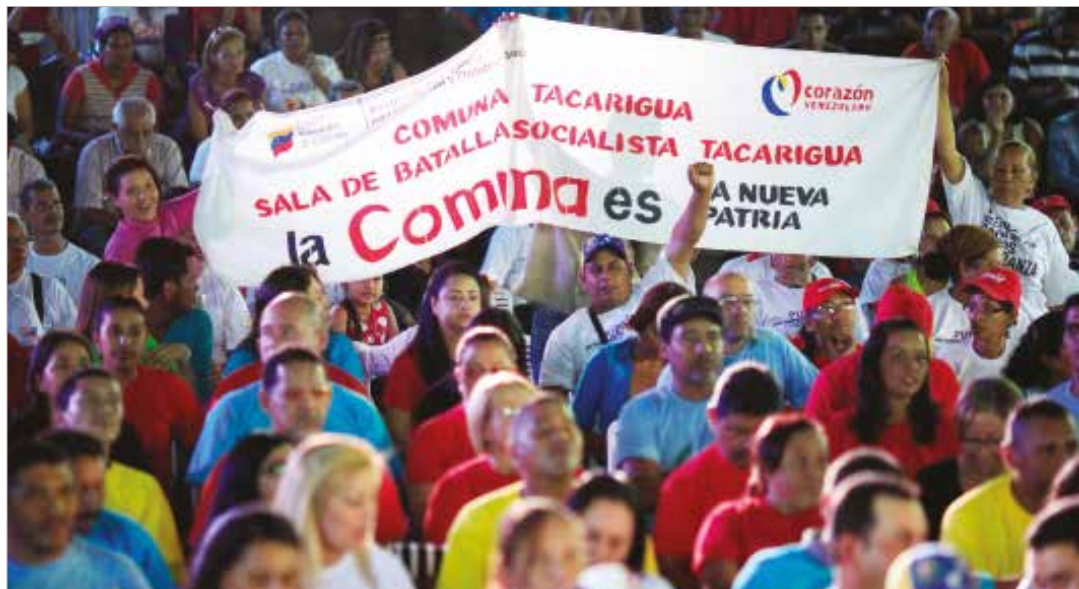
Este pueblo le va a dar una lección a la ultraderecha el próximo 6D.