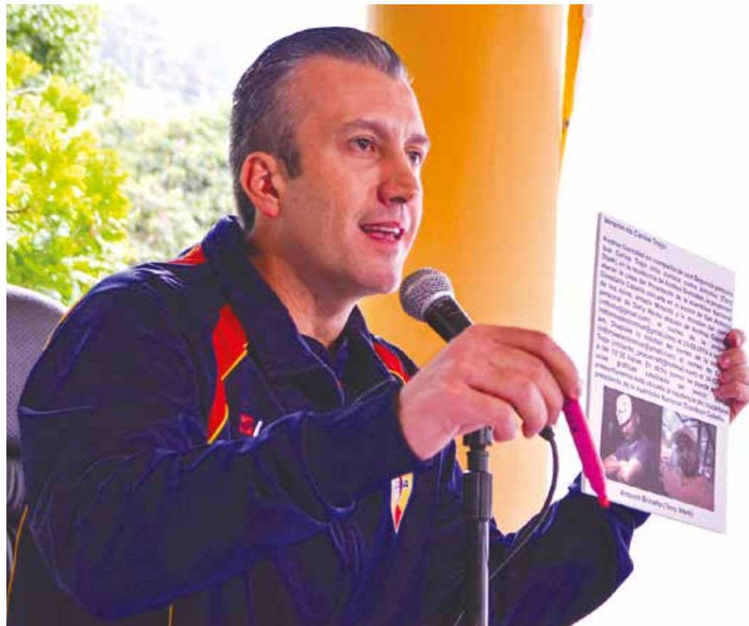
Estas expresiones violentas son brazos del imperialismo.