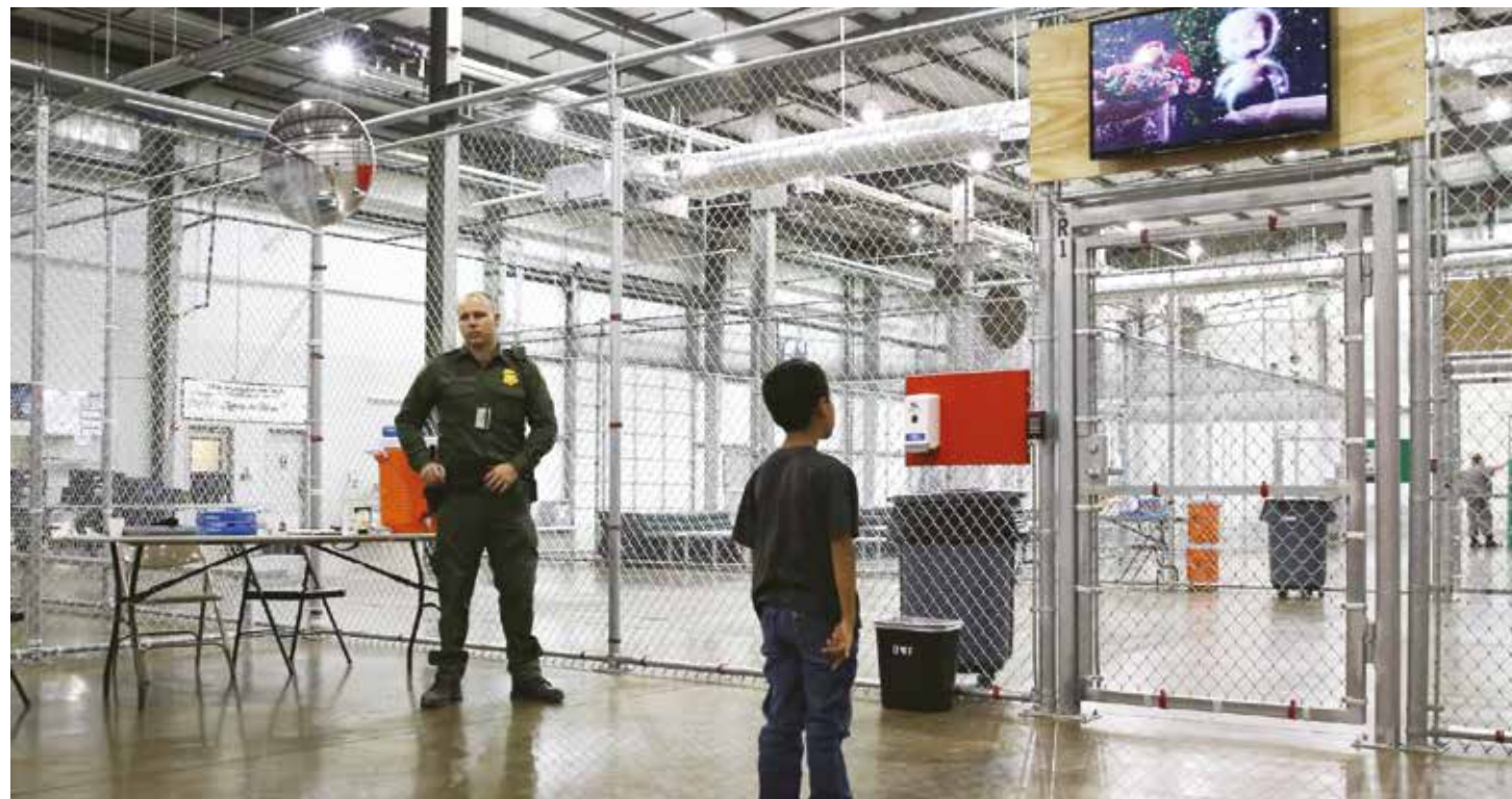
El centro de reclusión está principalmente poblado por mujeres y niños.

Y en lo inmediato debe buscarse la puesta en libertad de las mujeres y de los menores recluidos en los centros de detención pues, como señaló la legisladora Lofgren, no han cometido delito alguno y su situación es un agravio a la conciencia del mundo. •