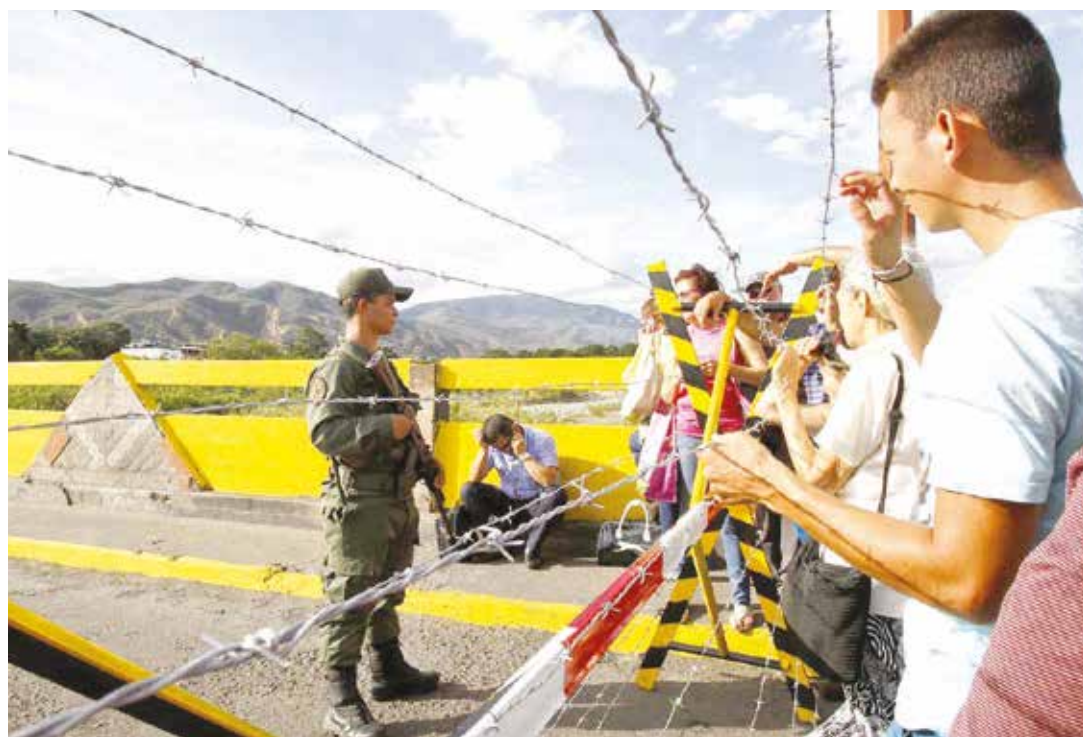
Muchos colombianos entraron sin pasaporte, lo que dificultó su retorno.

En Táchira cesaron las colas de mercaderes de combustible, mientras que en Cúcuta el suministro de combustible sencillamente colapsó