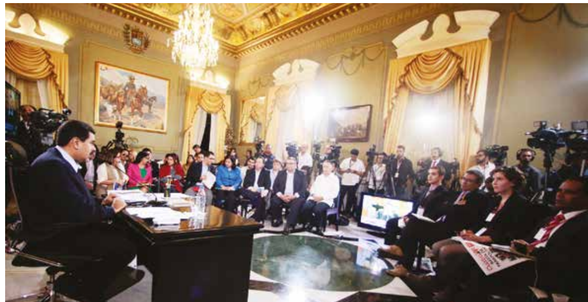
El Primer Mandatario exigió el cese de la conspiración desde Colombia