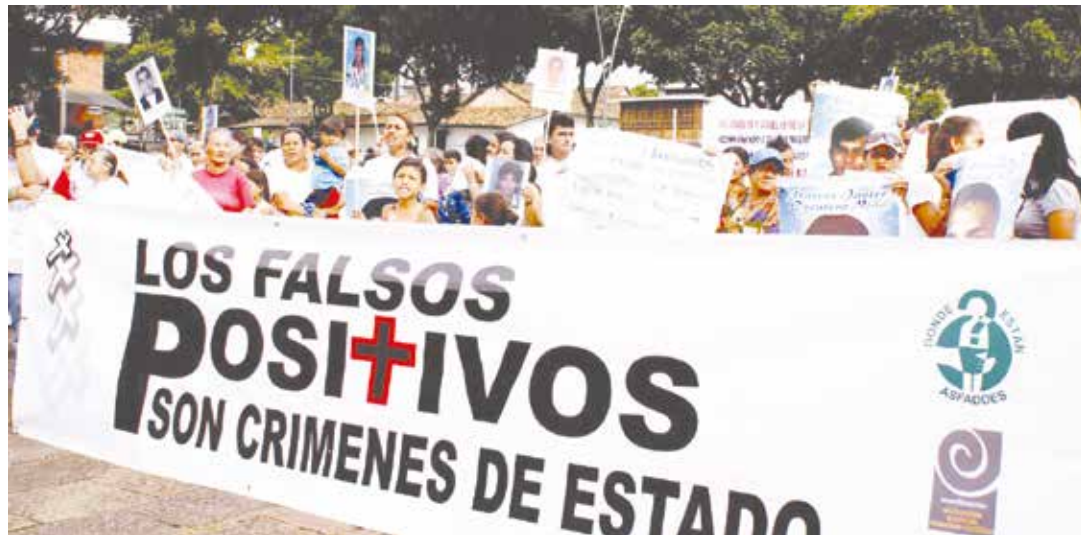
La huella de los "falsos positivos" sigue a Uribe como una mancha oscura.

El autor de los "falsos positivos" compara las deportaciones con el Holocausto