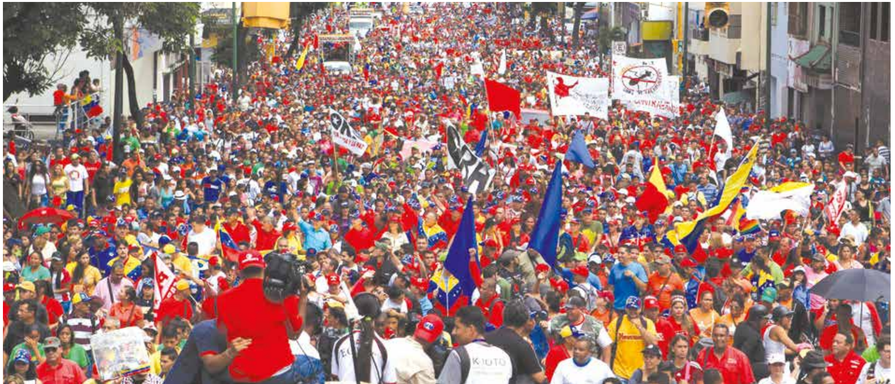
El Primer Mandatario anunció la creación de una nueva zona especial.

El Presidente aseguró estar dispuesto a reunirse "cara a cara" con el presidente de Colombia, Juan Manuel Santos, para tratar las posibles soluciones a la crítica situación que viven los venezolanos asentados en la zona fronteriza