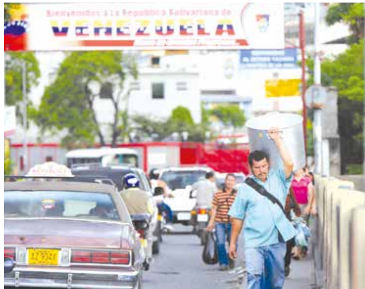
Toneladas de alimentos básicos eran contrabandeados a Colombia

Durante los días jueves 20 y viernes 21 de agosto, los servicios de transporte