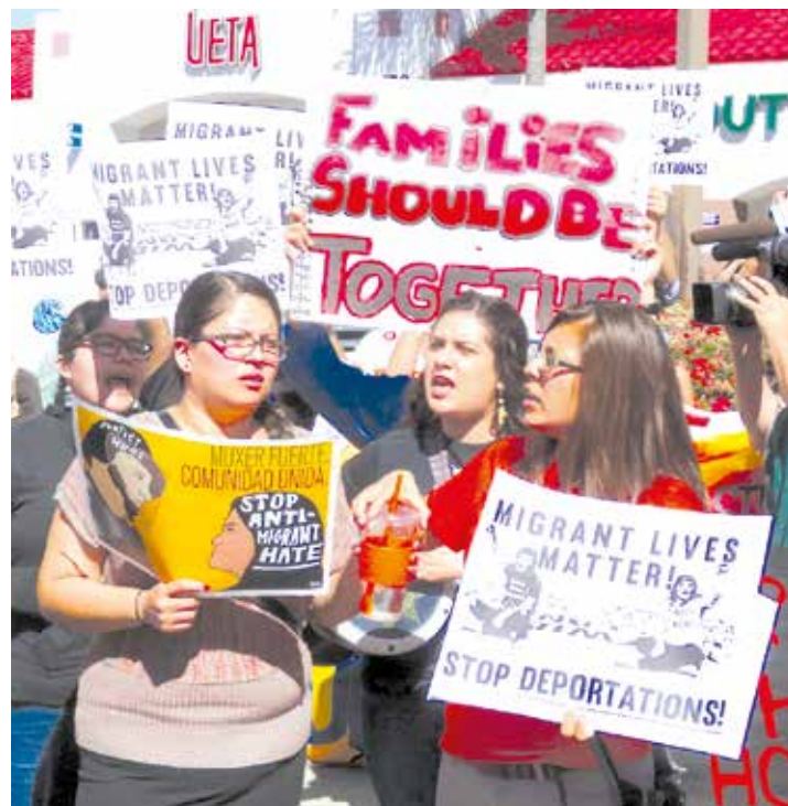
Obama deportó al mismo número de extranjeros que Bush en ocho años. •

gobierno, Obama deportó al mismo número de extranjeros que la administración de George W. Bush en ocho años y se calcula que el número de personas que han salido de territorio norteamericano durante el mandato de Obama es aproximadamente la misma cifra que salió entre 1892 y 1997, es decir más de cien años. •