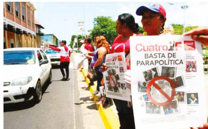
Las brigadas de APC se activaron en todo el territorio.

“ Desde esquinas calientes instaladas en las plazas Bolívar de todo el país, la militancia psuvista expresó su respaldo a las medidas tomadas por el presidente Maduro”