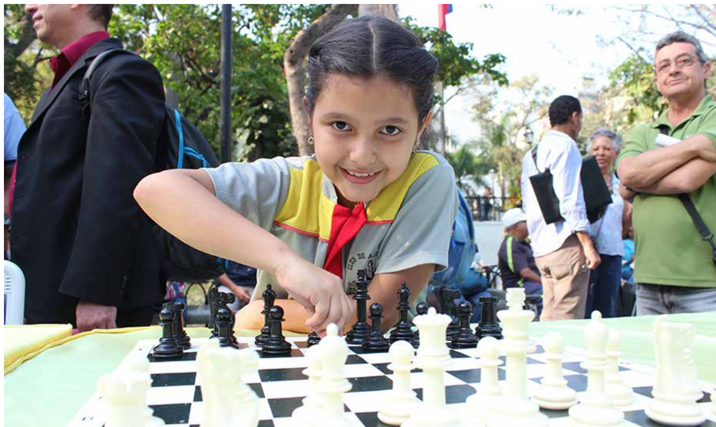
La actividad contó con 200 niñas y niños de las escuelas del Distrito Capital.

En la actividad se toma en cuenta el ajedrez como de-