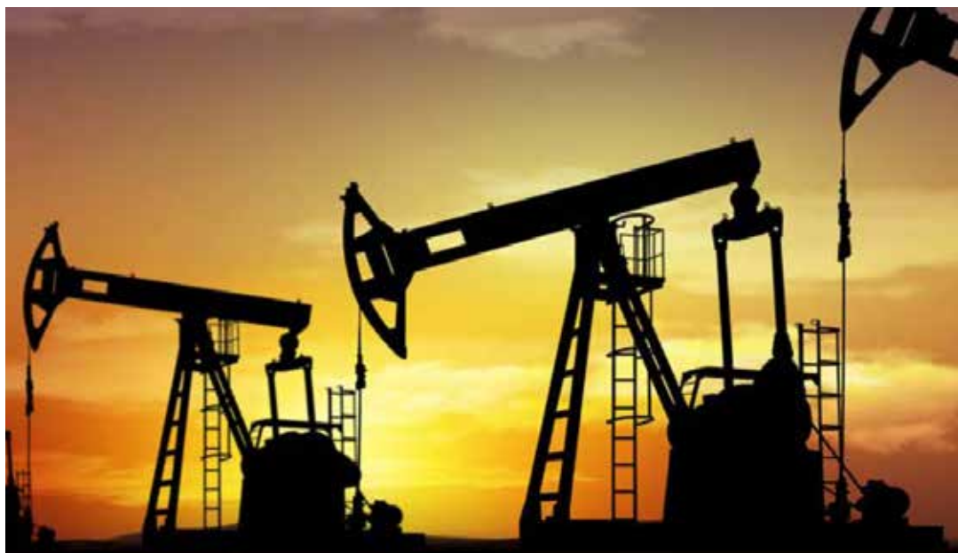
El precio actual está inhibiendo el desarrollo de los nuevos grandes yacimientos.

No hay estimaciones fiables alrededor del precio del crudo, como lo dijo el presidente Maduro en recientes declaraciones: "no está a la vista" la recuperación del precio del petróleo para este año, y es probable que la situación se mantenga así para el 2016. •