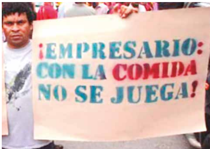
El pueblo se debe sumar al llamado contra la guerra económica.