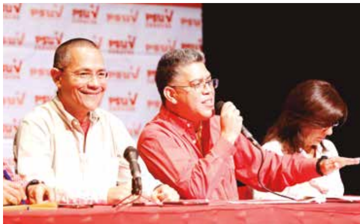
Las UBCh de Caracas, Vargas y Miranda, postularon 195 precandidatos.

Por último, el miembro de la Dirección Nacional del PSUV, Jorge Rodríguez, informó que por órdenes del presidente del PSUV, Nicolás Maduro, desde la militancia se financiará la campaña de todas las candidaturas que van a participar de forma equitativa en la elección del 28 de junio. •