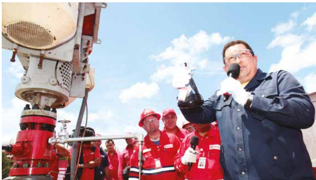
El plan estratégico para el año 2015 busca aumentar gradual y sostenidamente la producción de la Faja.

Durante el año 2014, de acuerdo al Ministerio del Poder Popular de Petróleo y Minería, el precio promedio del crudo venezolano fue 88,4 dólares el barril (en donde contrasta la cifra de 96,14 dólares en el primer trimestre respecto a los 67,69 dólares del último, cuando ya había comenzado la abrupta caída de precios del crudo) mientras que en el primer trimestre del presente año, el precio promedio se ubica en 44,96 dólares el barril (con una cifra mínima de 40,30 durante el mes de enero). La última semana del mes de abril, el precio había repuntado hasta los 52,61 dólares, en un aparente efecto de estabilización, especialmente debido a la compleja situación internacional y el declive del número de taladros activos en los Estados Unidos, entre otros factores señalados por