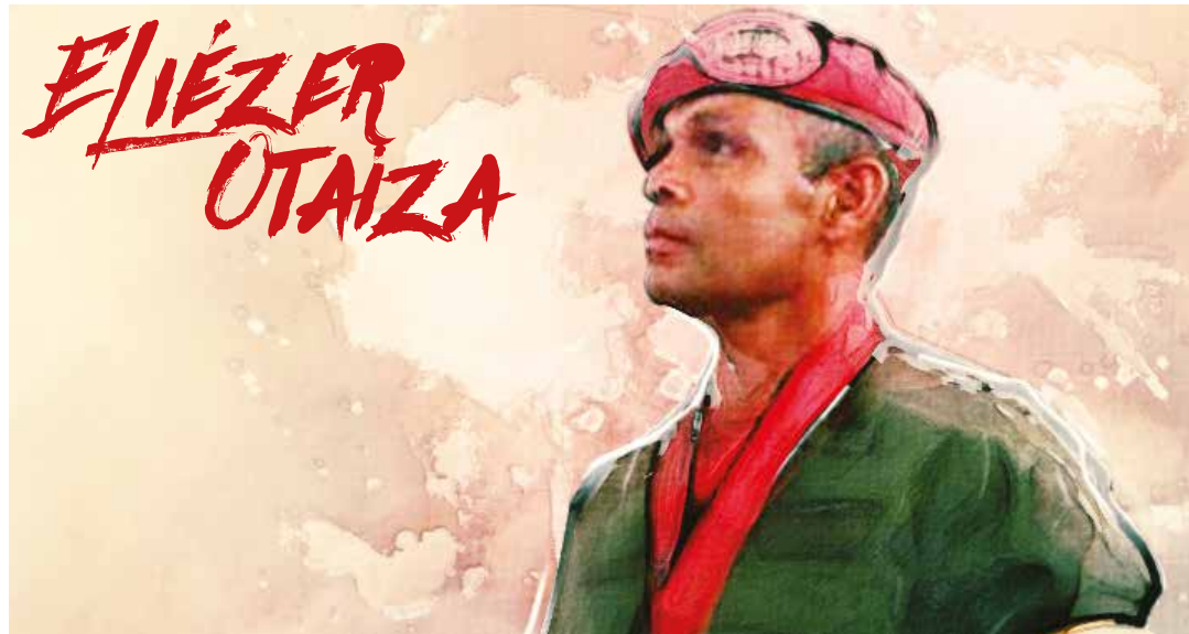
El asesinato de Otaiza fue ejecutado como un falso positivo para ser presentado como un acto delictivo.

Este horrendo crimen ha sido vinculado con el plan de asesinatos selectivos orquestado por la extrema derecha, cuya segunda víctima sería el diputado Robert Serra