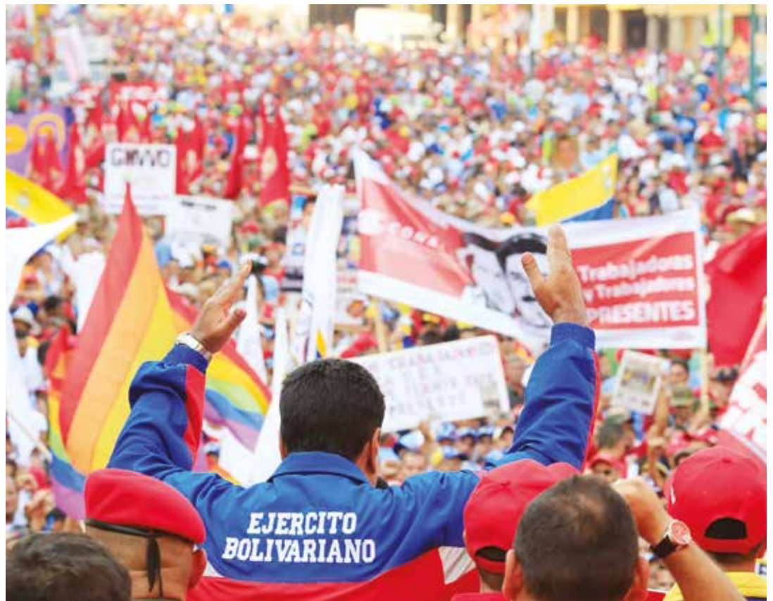
Estamos obligados a concentrar nuestros esfuerzos para vencer la guerra económica.

El presidente destacó el discurso de la líder sindical de la empresa pública Lácteos Los