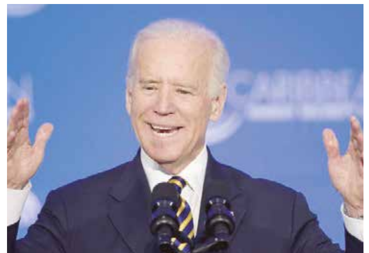
Joe Biden ofreció 20 millones de dólares a los países del Caricom.

Explicó que la estrategia de Obama se enmarcaba en una dinámica global, ya que en el 2014 se había producido un incremento sustancial de las relaciones de América Latina y el Caribe con China, Rusia