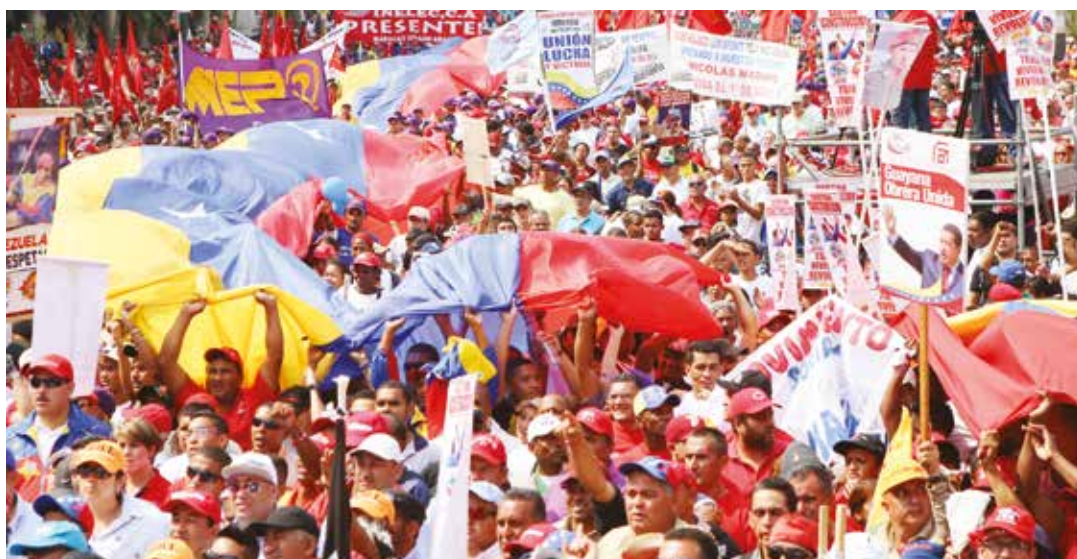
Se crearán los Consejos Comunales de Abastecimiento y Producción.

“Estamos obligados a concentrar todos nuestros esfuerzos, inteligencia, organización y capacidad de lucha, para vencer la guerra económica de los capitalistas y de los pelucones”, señaló el jefe