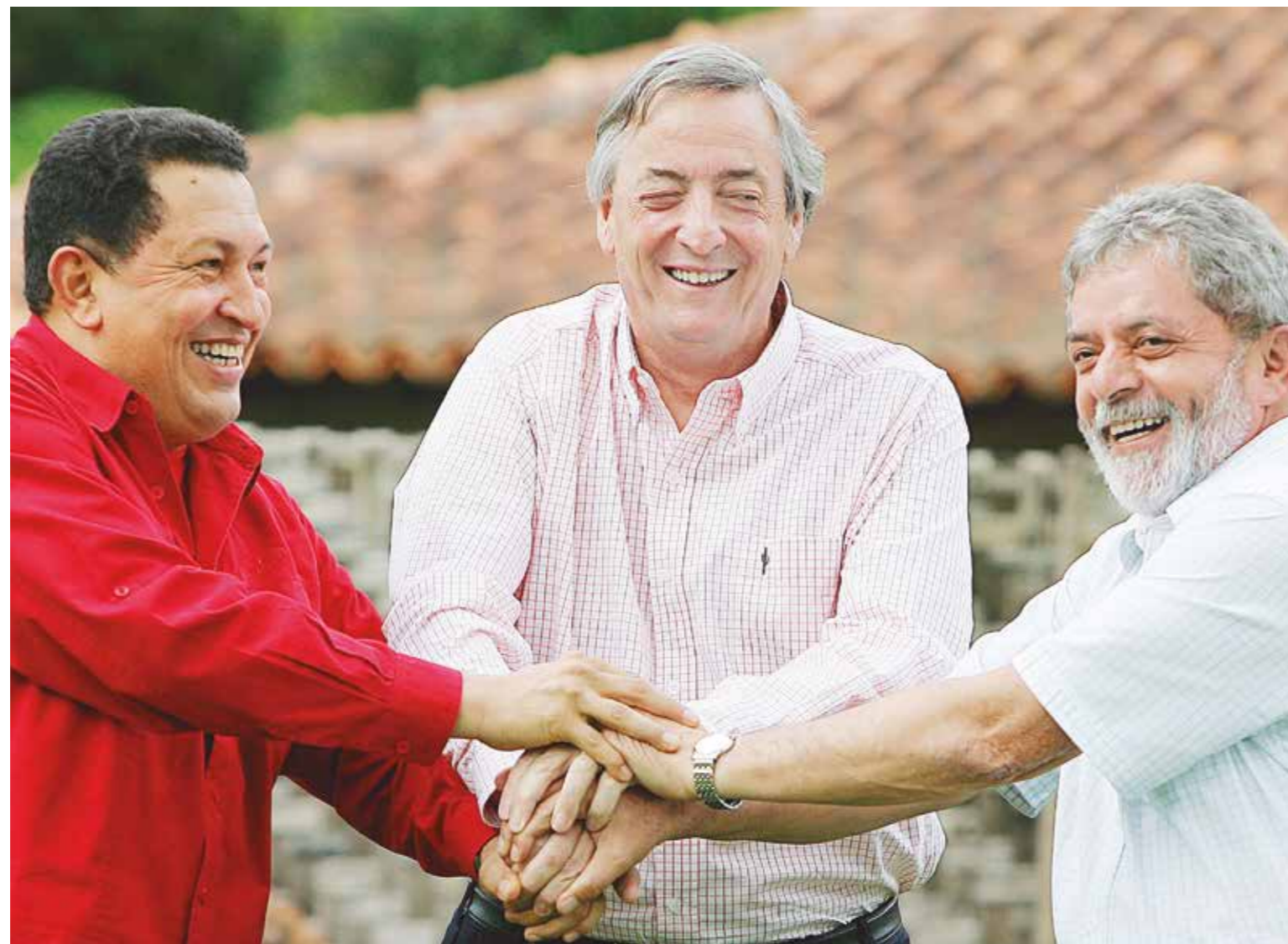
Con el impulso del huracán bolivariano surgieron líderes y gobiernos antiimperialistas que enterraron al ALCA

En la II Cumbre de las Américas, celebrada en Santiago de Chile, en abril de 1988, la agenda estuvo marcada por los avances de cada país para amoldar sus economías al Área de Libre Comercio. Parecía no existir ninguna alternativa, las naciones latinoamericanas estaban condenadas a colocar su producción y recursos al servicio de las trasnacionales estadounidenses.