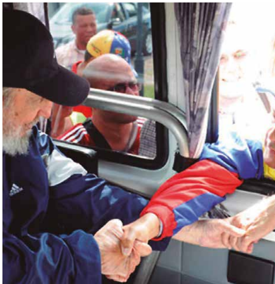
Fidel Castro Ruz

Decenas de países a escala mundial han rechazado el decreto injerencista firmado por el presidente Barack Obama contra la República Bolivariana de Venezuela. La campaña en defensa de esta nación se multiplicó por todos los rincones del Mundo y se expresa en la contundente afirmación "Obama deroga el decreto Ya" y "Venezuela no es una amenaza, somos una esperanza".