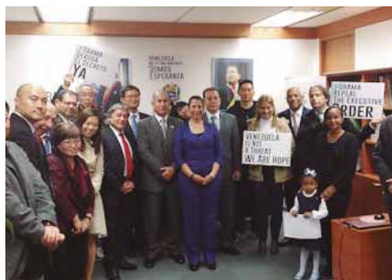
Corea del Norte