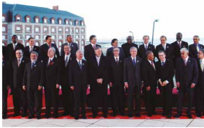
IV Cumbre de las Américas, Mar del Plata, Argentina, 2005

Además de los gobiernos progresistas que acuden, más de 2 mil representantes de los movimientos sociales estarán en paralelo en la Cumbre de los Pueblos, y se encargarán de recordarle al imperialismo, que no estamos dispuestos a retroceder porque no tenemos elección. Es la vida, la felicidad y la Paz que defendemos con Bolívar y Chávez al frente, o es la barbarie, la guerra y la explotación capitalista que nos ofrece el Norte. •