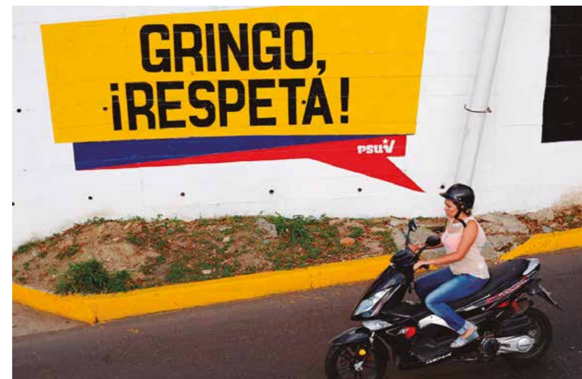
Estamos en un tiempo de deficiones sobre cuál de las dos Américas será la próxima protagonista de la historia.

Existen los que miran hacia fuera y los que lo hacen hacia dentro para pensar en América Latina