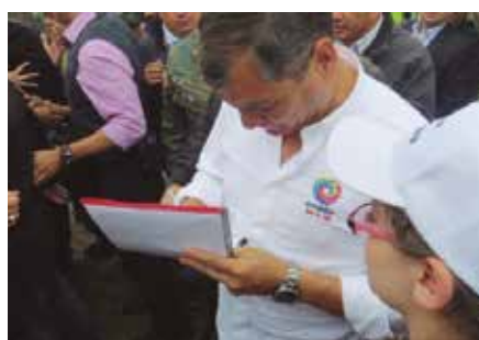
Presidente de Ecuador, Rafael Correa