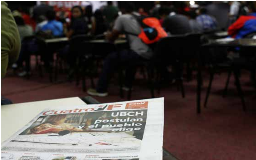
Exitosa jornada de postulación.

mayor de 30 años y una en edad comprendida entre 21 a 30 años) y dos hombres (uno mayor de 30 años y otro entre 21 a 30 años de edad), en cumplimiento con la paridad de candidatas solicitada por el presidente del partido, Nicolás Maduro.