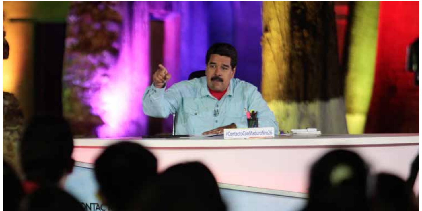
Maduro: Los dólares de la República son del pueblo.