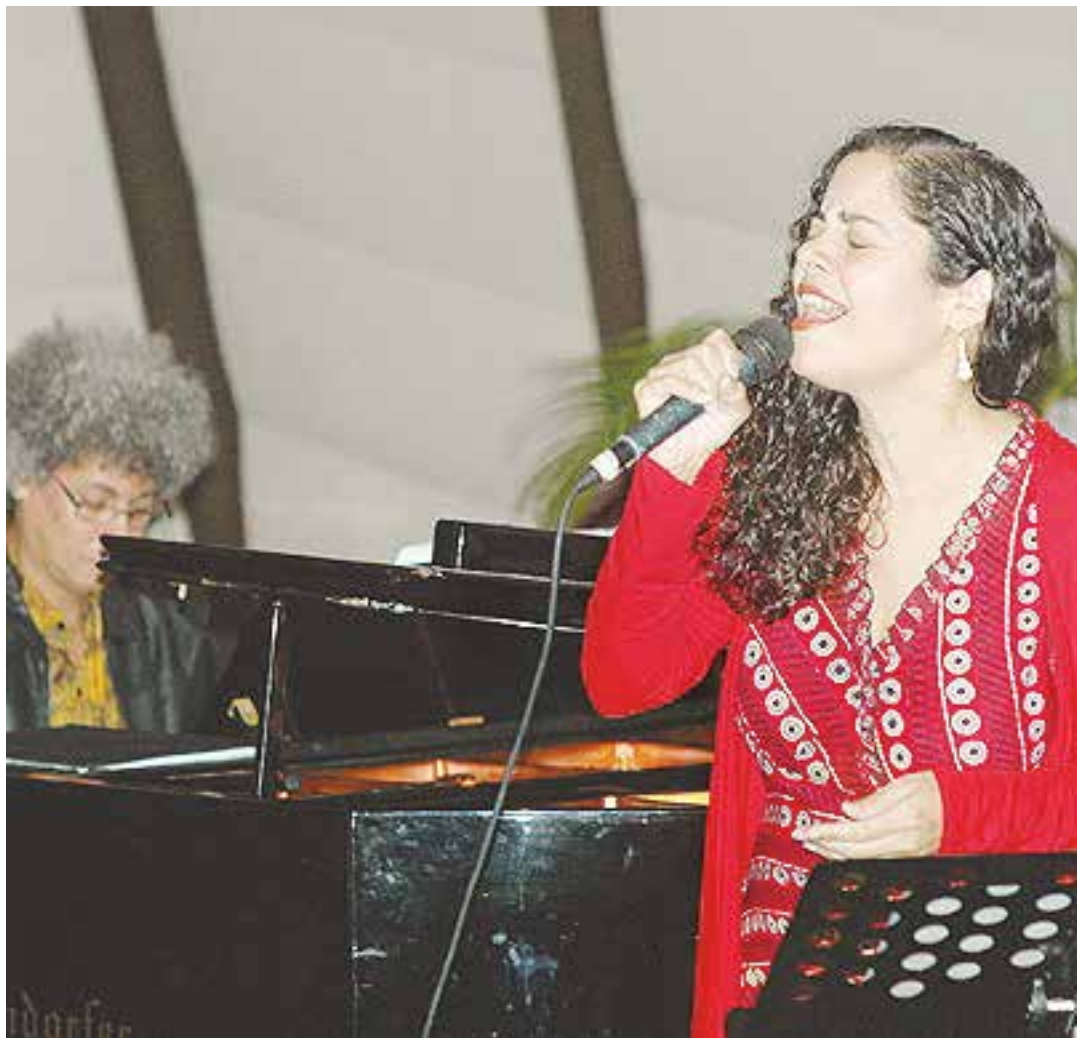
La gente sigue cantando mucho, sigue llevando su serenata.

ocurre por lo general en el entorno familiar: un padre, una madre, que tiene una buena discografía bolerística. ¿Es este el espacio de socialización con el bolero primario para ti?