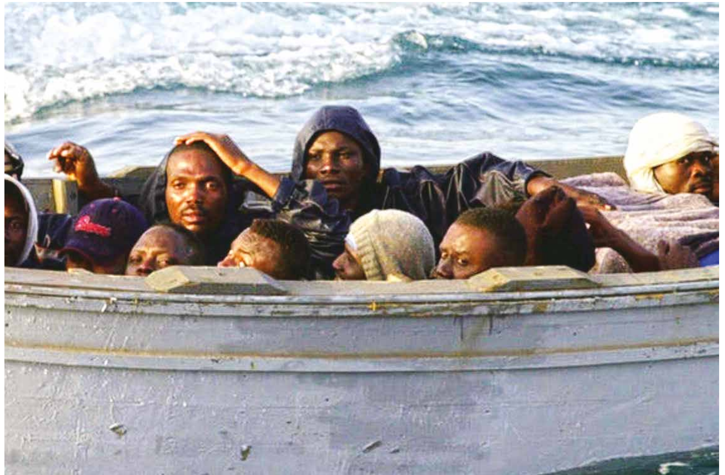
En las fronteras marítimas que separan a Europa de África ocurre una gran crisis humanitaria.

La criminalización de los flujos migratorios y el rechazo de los inmigrantes en general, son las máximas de la política migratoria en la Unión Europea. Resulta escandaloso que los esfuerzos para mitigar esta situación sólo tienen un enfoque policial y de control que se materializan a través de la Agencia Europea para la Gestión de la Cooperación Operativa en las Fronteras Exteriores (Frontex), la cual recibe un presupuesto millonario destinado al equipamiento de fuerzas armadas y equipos de patrullaje fronterizo. En analogía con el muro que separa