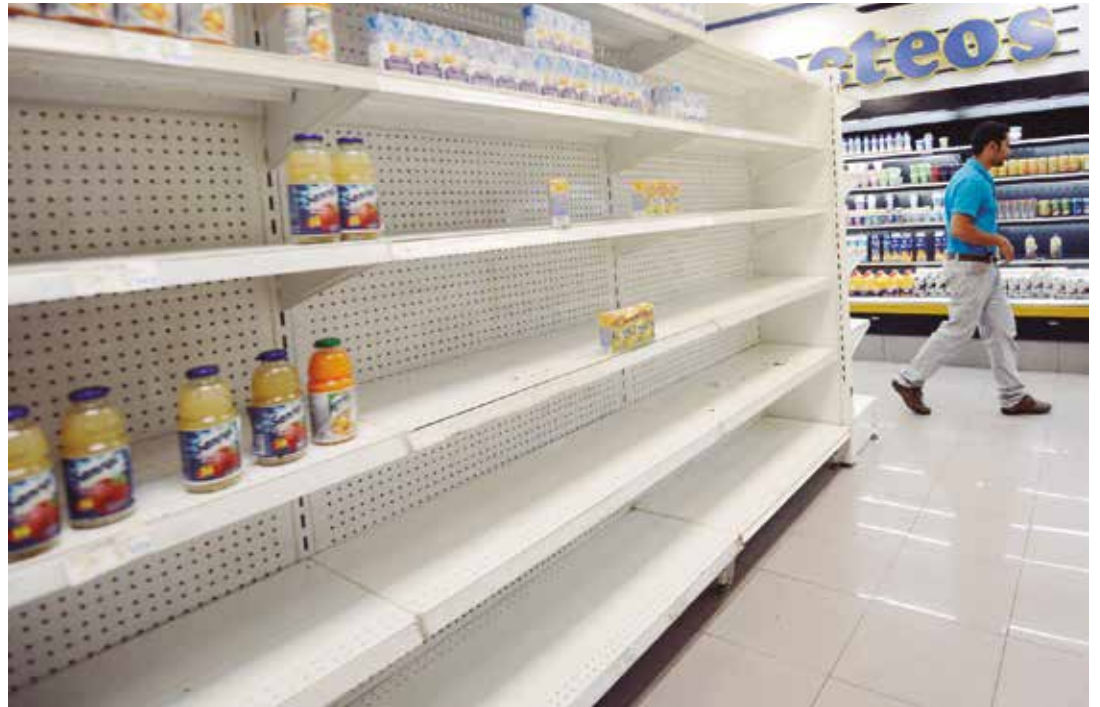
La oligarquía prefiere no producir en su objetivo de derrocar el gobierno.

“ Fedecamáras, Fedegro, Fedenaga y todos sus monstruosos tentáculos, llevan a cabo un paro no declarado. Hay quienes aseguran que prefieren no producir para tumbar al gobierno”