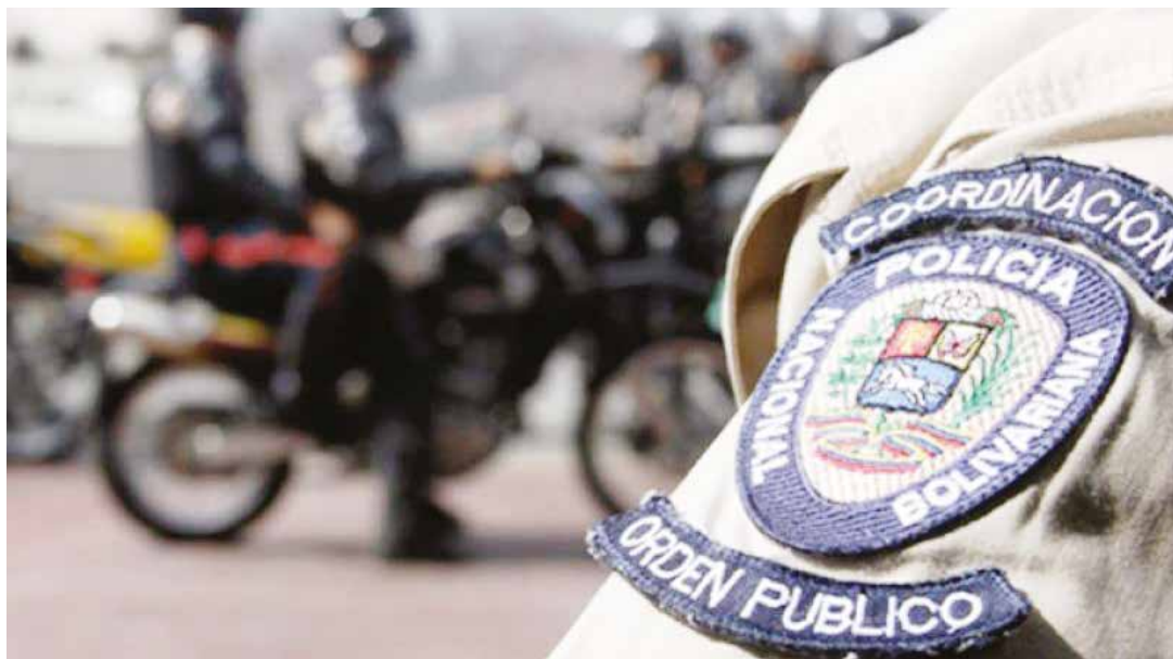
La repentina ola de asesinatos de policías oculta tras de sí, un móvil político.

El otro elemento al cual hizo mención el ministro en su denuncia, es que en las agresiones criminales, sobre todo, contra policías y funcionarios de seguridad adscritos al Gobierno Nacional, estarían participando paramilitares colombianos.