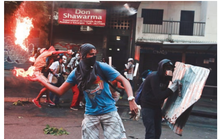
Por primera vez se publica en Gaceta Oficial una normativa en esta materia

Satanizan esta resolución para esconder los avances de Venezuela en derechos humanos