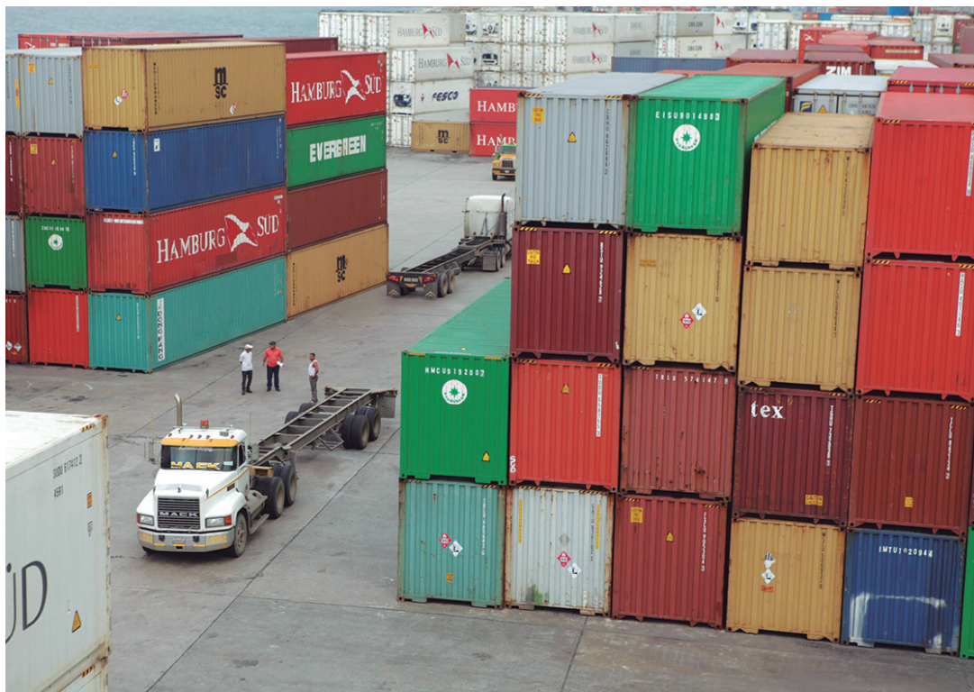
Importadores traen contenedores vacíos y productos de menor calidad

Esa situación ha determinado que actualmente las empresas estén comprando activos en el país como inmuebles. Incluso eso explicaría que P&G y Nestlé hayan instalado nuevas plantas en el país entre 2012 y 2013 que, además de absorber esos recursos, les servirán para sustentar sus exportaciones al norte de Brasil, aprovechando las ventajas arancelarias ofrecidas por Mercosur. •