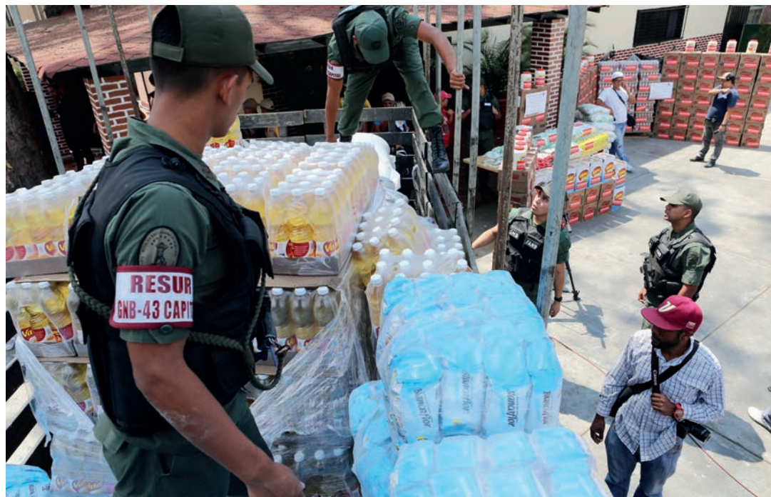
Miles de productos incautados fueron vendidos a precios justos en barriadas caraqueñas.

Considera que los medios de la derecha tratan de esconder este avance en derechos humanos, porque quienes pretenden sancionar a Venezuela acusándola de violar los DD.HH, no pueden permitir que se conozcan los avances del Estado venezolano en esta materia. •