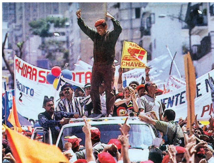
Comandante Chávez derrota electoralmente a la pseudo democracia puntofijista

“ Un grupo de oficiales medios, llevaron adelante una insurrección militar con el objetivo de establecer un nuevo gobierno y avanzar hacia la refundación de la República”