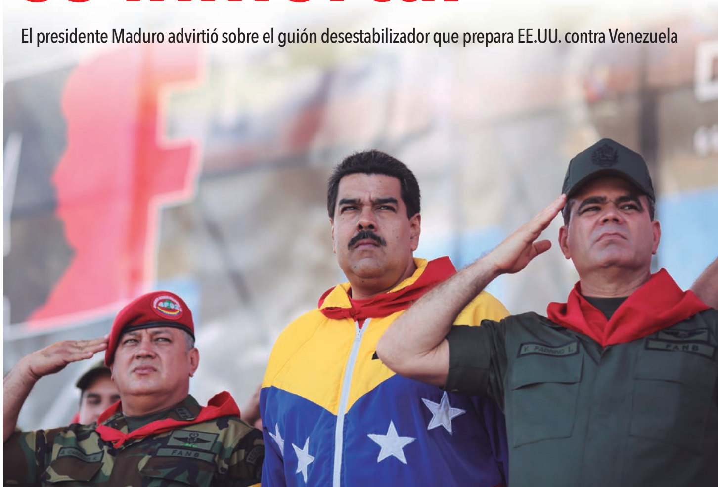
El presidente Maduro alertó ante las intenciones de ejecutar un golpe cuento contra Venezuela.

El presidente Maduro advirtió sobre el guión desestabilizador que prepara EE.UU. contra Venezuela