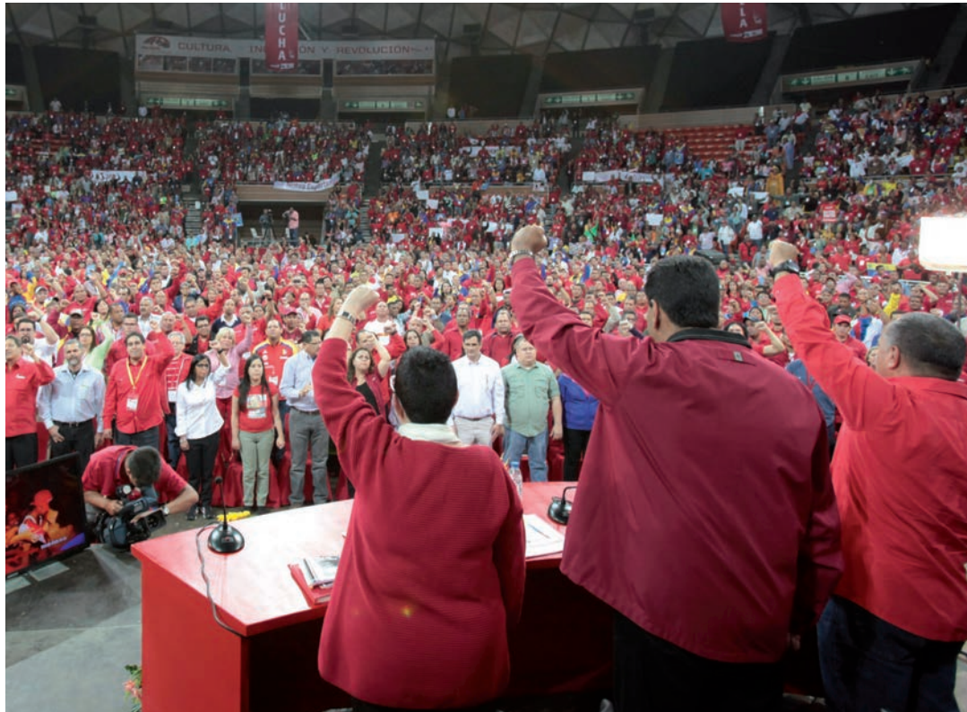
Poliedro de Caracas, plenario por Círculos de Luchas Populares, y miembros del III Congreso del Psuv

El Consejo Político Ampliado estará conformado por José Vicente Rangel, Jesús