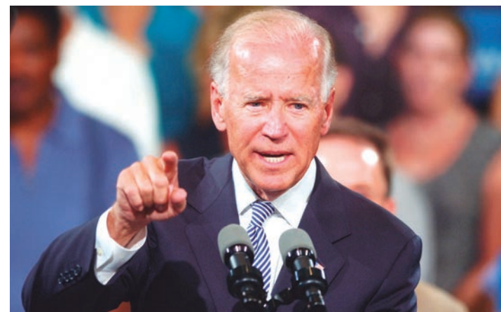
Joseph Biden, vicepresidente de EE.UU, amenazó con un golpe contra Venezuela.

Es importante introducir parte de los acuerdos de la CELAC, que como organización de unidad regional ha sido la suma de los acuerdos de integración latinoamericana, que se ha sustentado en la diversidad ideológica de las naciones miembros, no en la divergencia, sino en el consenso ante presiones externas. Hoy ha sido el ataque a Petrocaribe tratando de minimizar su papel social en relaciones de mutuo acuerdo, mañana intentarán dividir la CELAC para imponer la OEA, instrumento histórico, como la ONU, de dominación de EE.UU y sus socios. Solo la unidad de los pueblos y las naciones latinoamericanas serán los garantes de la Independencia, luego de 200 años de subcolonialismo y dependencia del capitalismo neoliberal. •