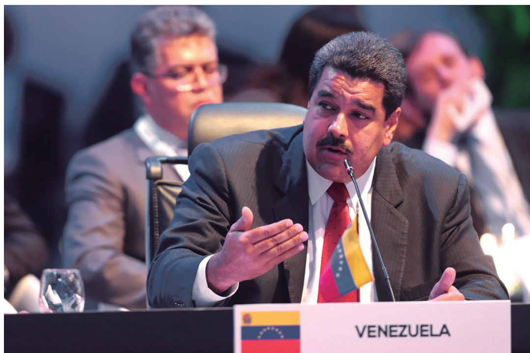
El presidente Maduro señaló que EE.UU conspira contra el gobierno legítimo de Venezuela.

Afirmando que "ha arrancado una campaña de guerra psicológica mundial para justificar un golpe de estado en Venezuela, sustentado en