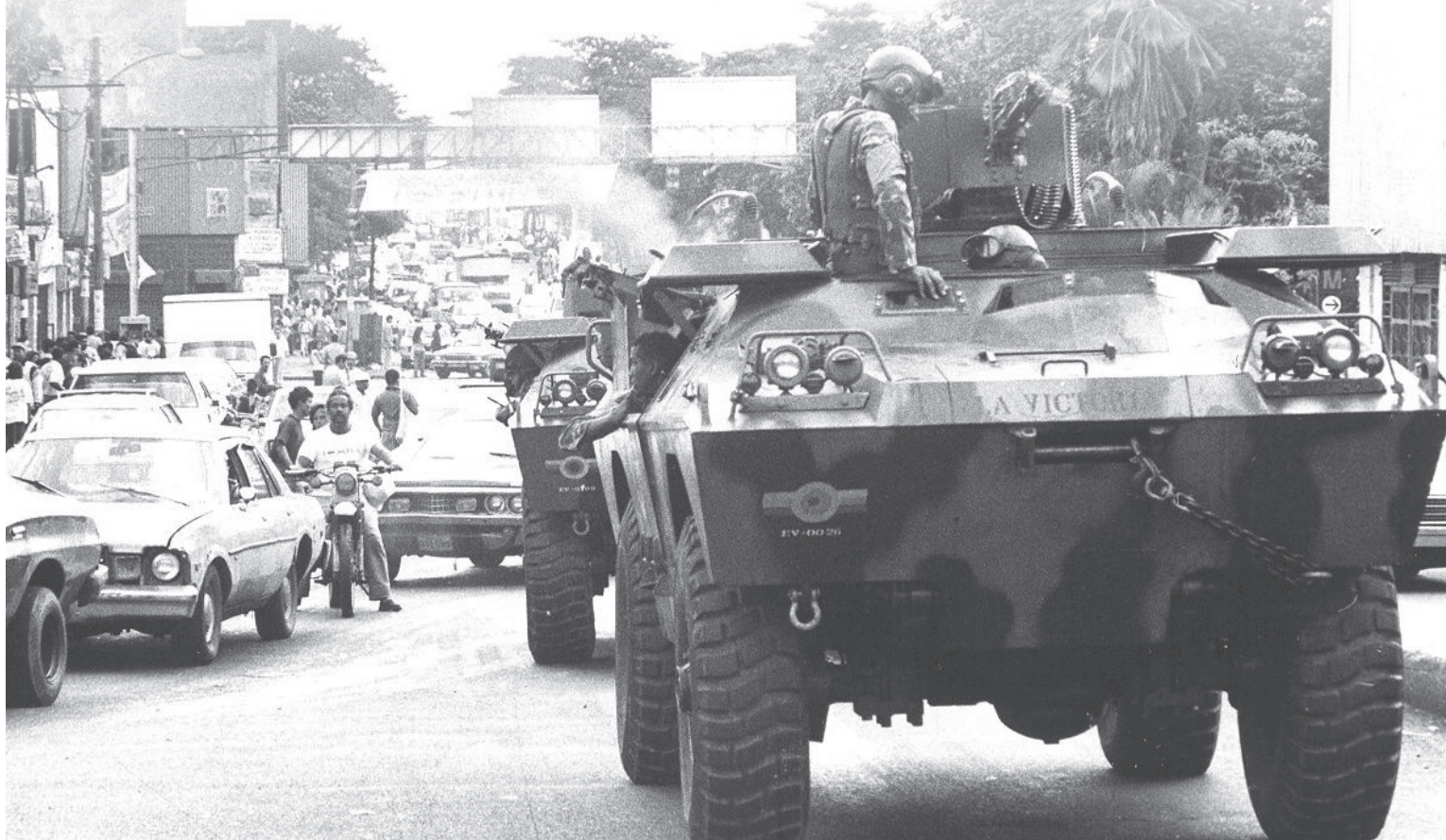
Tanquetas rebeldes recorrieron las calles de Caracas, en plena insurrección militar.