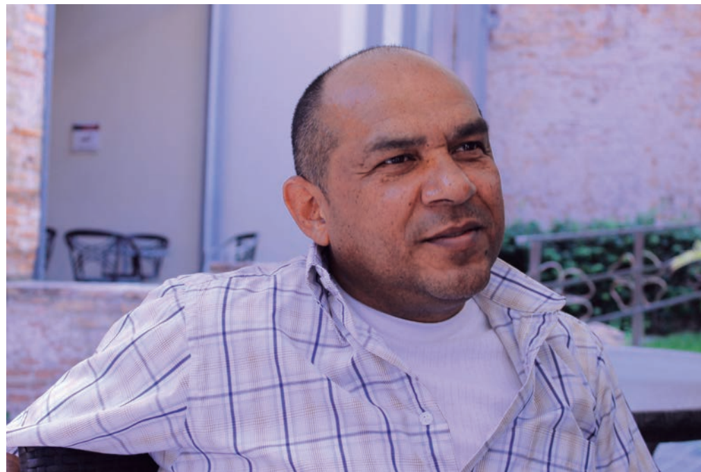
El país necesita una canción que movilice al pueblo en defensa de sus conquistas